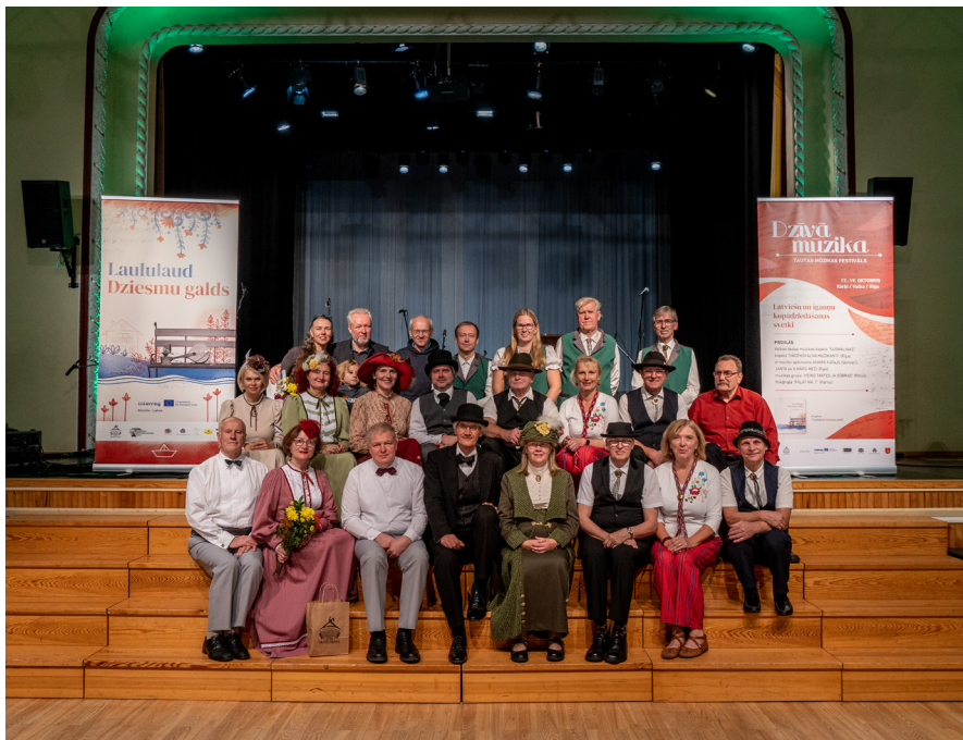
Mūzikas festivāla "Dzīvā mūzika" dalībnieku kopbilde.