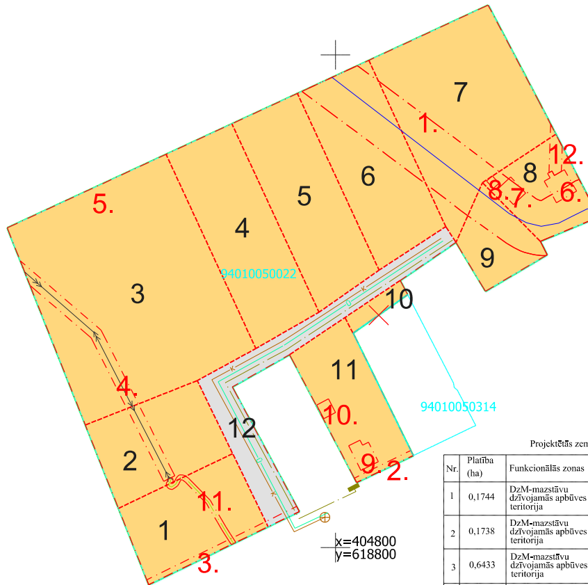
Projektētās zemes vienības