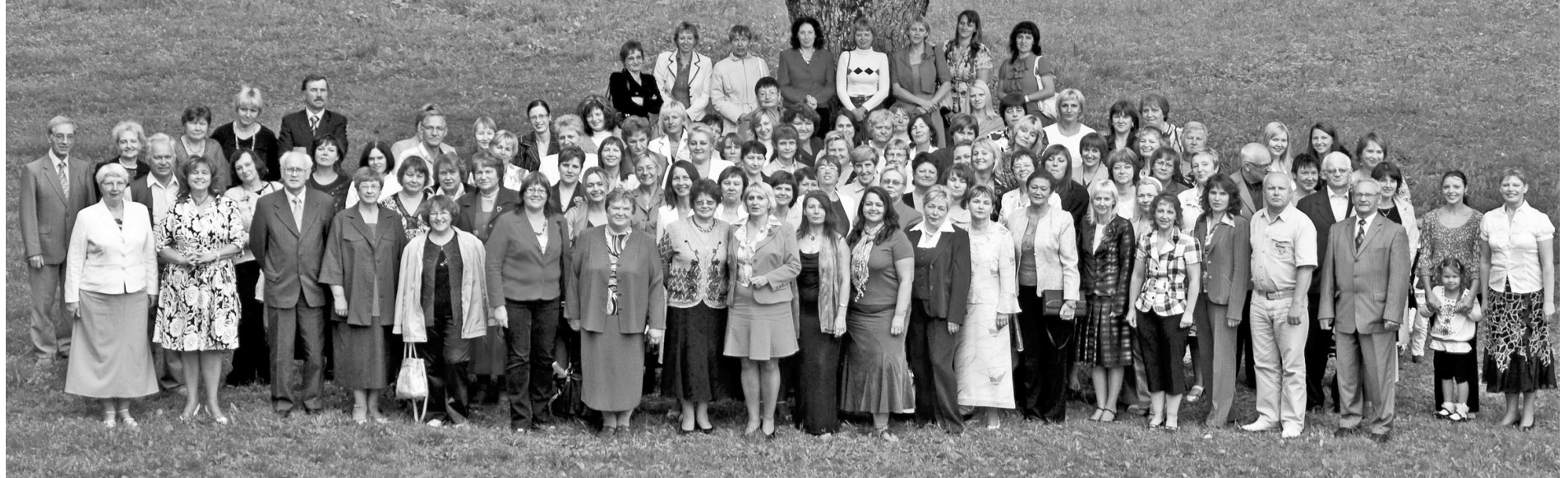
Zem Lugažu muižas kuplā ozola pietiek vietas, lai pulcētos visa Valkas novada pedagogu saime.