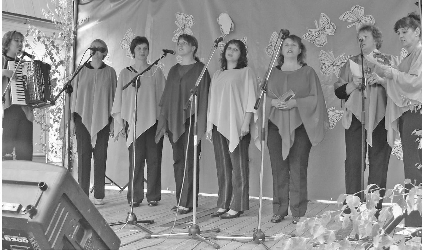
Zvārtavas pagasta vokālais ansamblis priecē skatītājus Valkas novada svētkos.