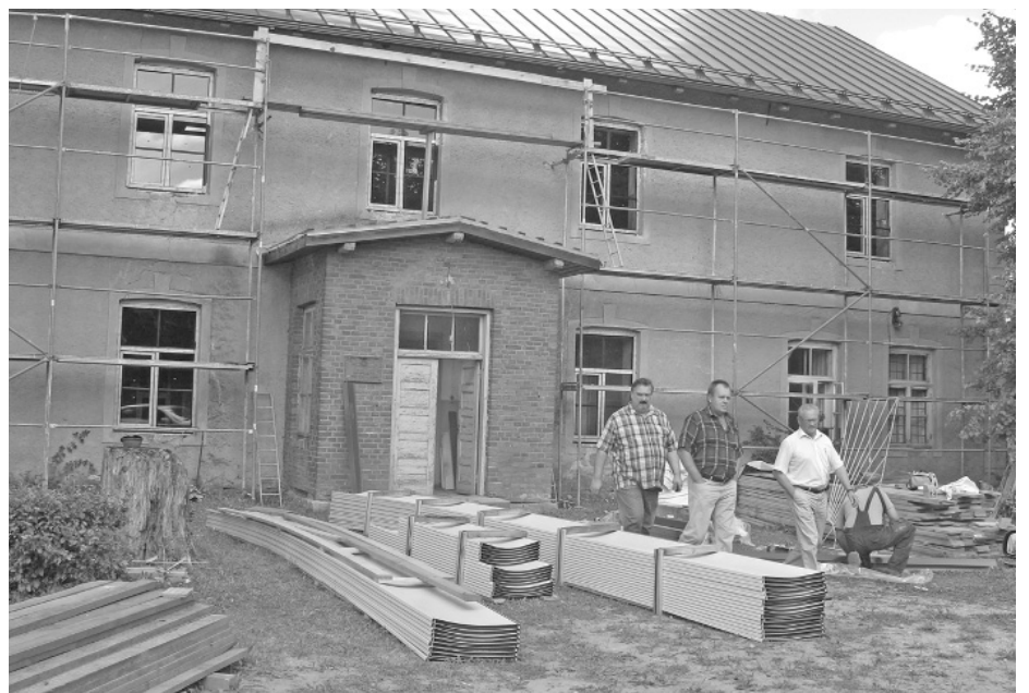
Rit Mierkalna tautas nama rekonstrukcijas darbi.

Savukārt Mierkalna tautas nama vienkāršotās rekonstrukcijas darbus veic būvfirma SIA „Valkas būvnieks”. Projekta ietvaros tiks uzlikts jauns jumta segums, nosiltinot ēkas bēniņus, kā arī nomainīti logi un ārdurvis. Remonts nepieciešams arī iekštelpām, tāpēc tiks meklētas iespējas finansējuma piesaistei tautas nama iekštelpu renovācijai.