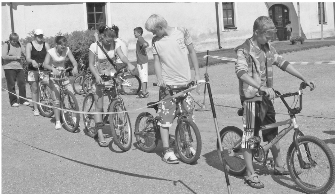
Pagājušajā gadā pirmo reizi uz starta izbrauca veloorientēšanās sacensību dalībnieki.

„27.augustā pulksten 18.00 sāksies orientēšanās sacensības, kam ir senas tradīcijas. Kontrolpunktos tiek doti dažādi uzdevumi, kas balstās uz principu – lasi un skrien, taču nereti sacensību karstumā notiek pilnīgi otrādi – vispirms skrien un tikai tad lasa. Šajās sacensībās bieži uzvar nevis veiklākais, bet gan apdomīgākais skrējējs. Pagājušajā gadā sacensības notika pēc principa – skrējienis pēc miljona. Kādā no posmiem bija teikts – var aizskriet uz māju pie vecākiem un ceļa posmu veikt ar