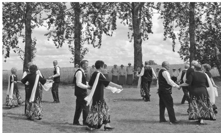
Gulbenes novada deju kopa „Reverans” priecē skatītājus ar izveicību un raito deju soli.