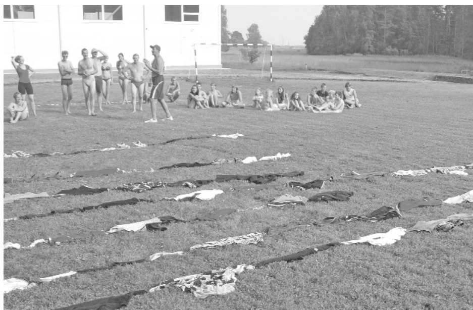
Svētku laikā komandām visārtiskākās izvērtās sacensības par garāko drēbju virteni.

Svētku noskaņu patīkami papildināja Daces Picēses un Laimas Vartas vadībā ga-