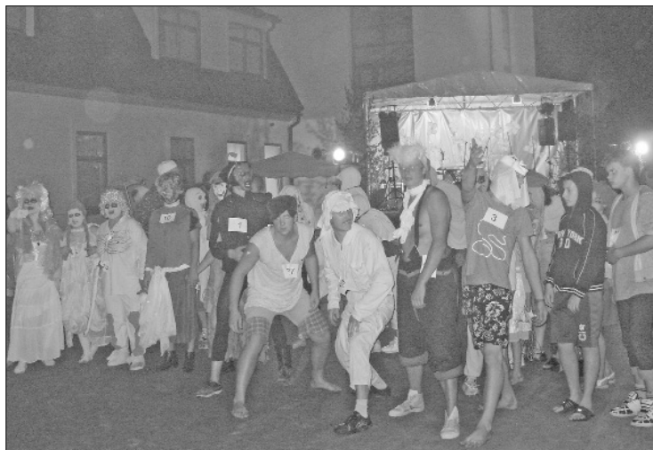
Tiek dots starts pirmajam spēku skrējienam.