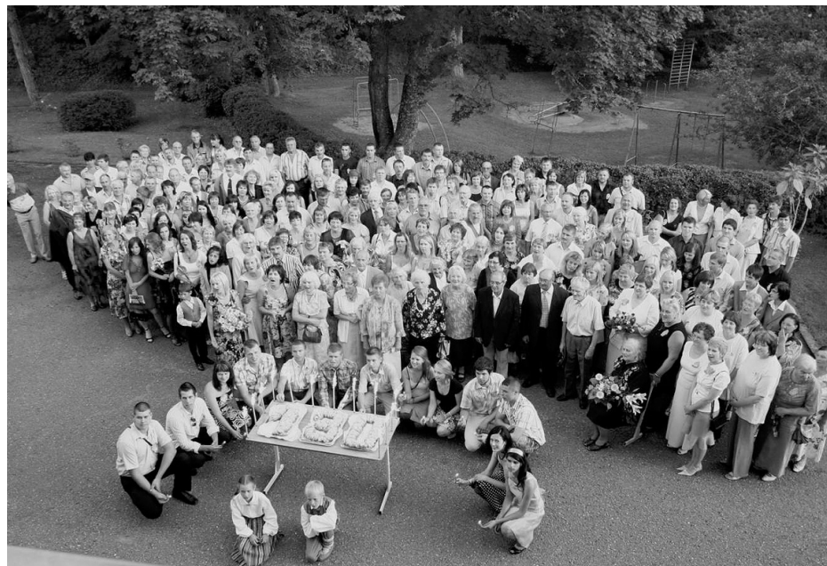
Satīšanās prieks un kopīgs jubilejas kliņģeris.