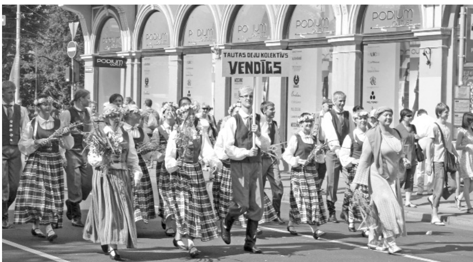
Valkas ģimnāzijas deju kolektīvs „Vendīgs” X Latvijas Skolēnu dziesmu un deju svētku gājienā.

Jūlijā, pašā vasaras un dabas pilniedzā, Rīgā jau desmito reizi notika Skolēnu dziesmu un deju svētki. Šogad svētku atpazīšanas zīme bija krāsu vilciņš kā svītru kods, kas simbolizē Latvijas novadus, jaunību un mūžīgo griešanos ap Sauli. Valkas ģimnāziju svētkos pārstāvēja deju ko-