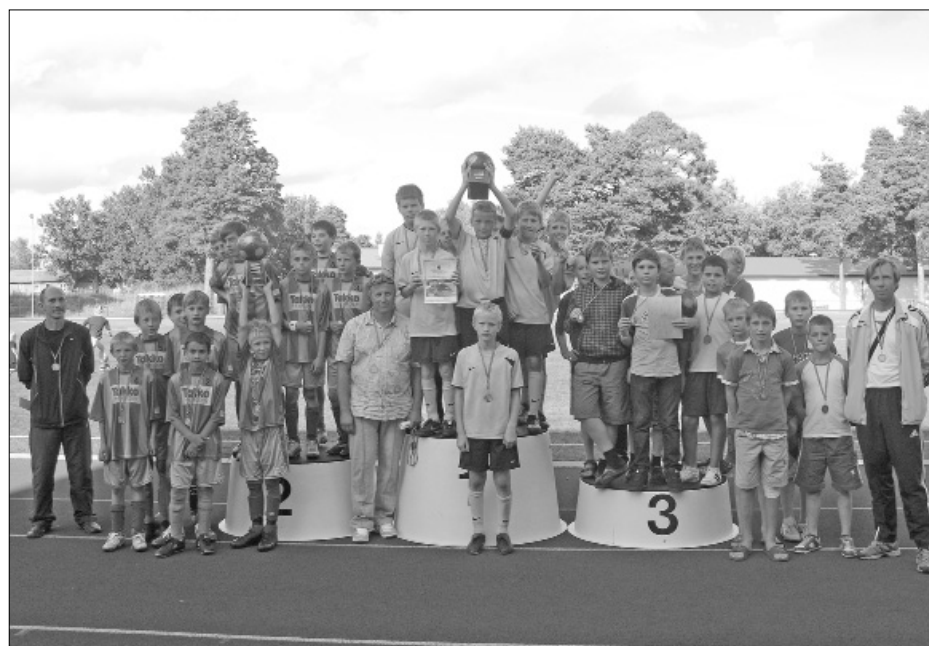
Var uzgavilēt pirmo trīs vietu ieguvēji ar godam izcīnītajiem Valkas novada kausiem un medaļām.