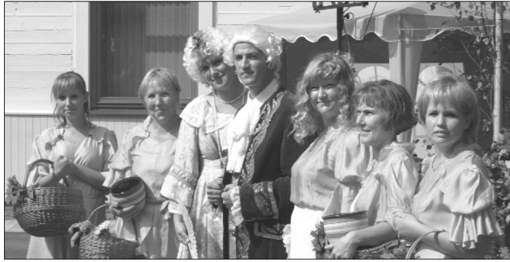
Muižkundze un muižkungs ar preilenēm sagaida svētku viesus.

Svētku meijas jau sasieta slotiņās, zirgi apkalti, Lugažu muižas parks ievirpuļots ar skanīgām dziesmām un raijiem deju soļiem, kaimiņi iepazīti, spoki satikti. Katram, kurš piedalījās svētkos, raisījās sajūtas, ka šī skaistā muiža ir vieta, kur kādreiz gribas atkal atgriezties.