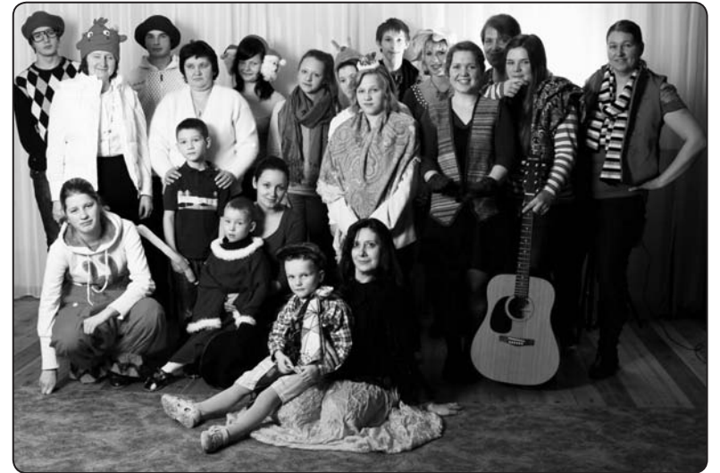
Valkas pagasta un Valkas mazpulku jaunieši kopā ar bērnu nama audzēkņiem labdarības pasākumā Reīna Dorša improvizētajā fotosalonā iemūžina svētku mirklus

Visu decembri Ērgemes bērnu namā-patversmē valda liksma rosība. Nedēļas nogalēs mājās atgriežas arodskolēni, tiek ceptas piparkūkas, gatavoti Ziemassvētku rotājumi, spriests un pārrunāts šajā gadā paveiktais.