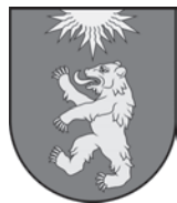
Valkas novada dome