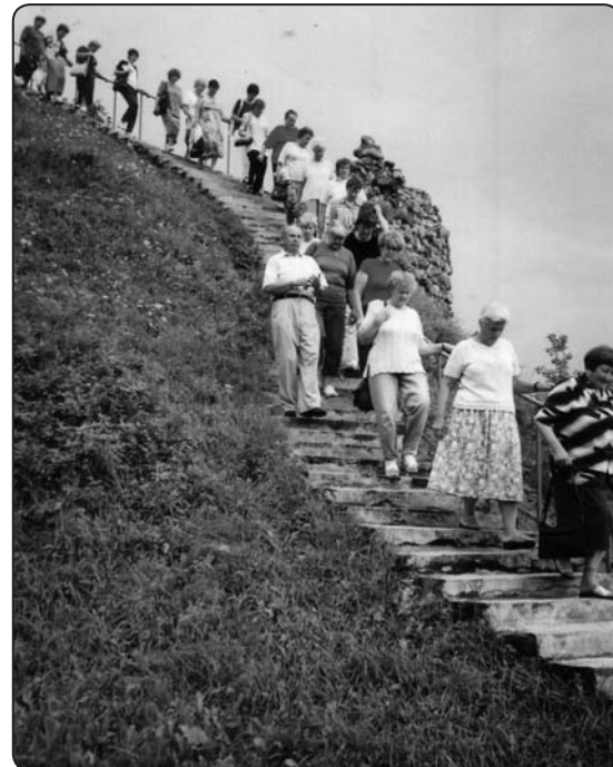
Spēka mums pietiek un bail nav ne no kā! Tā var sacīt ekskursijas dalībnieki, kāpjot stāvajā Rēzeknes pilskalnā