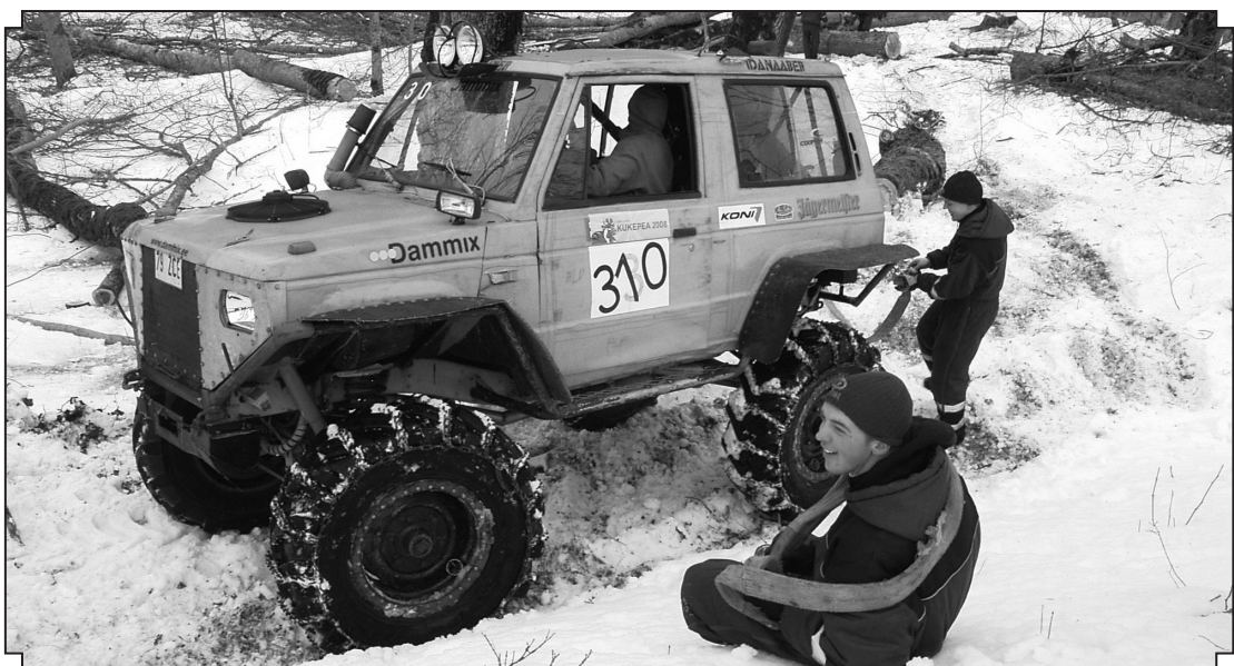
Ziemā bezceļu auto kluba biedri ar saviem «monstriem» pulcējas, lai sakoptu citiem neizbraucamas vietas

Apmeklētājiem tomēr būs jāiegādājas ieejas biļetes – divdienu biļete 12 eiro, tikai svētdienas biļete – 5 EUR, vienas reizes autostāvieta 1 EUR, bērniem, kuru augums mazāks nekā 1,2 m – bez maksas. Visas ieejas biļetes piedalās loterijā. Uz koncertu atsevišķi biļetes nepārdodas, jo «Metsatöll» vidēji «smagi orientētam» igauņim ir kā medudmaize. Teritorijā vieniem nav atļauts atrasties bērniem līdz 16 gadu vecumam. Rīkotāji brīdina – drošības pasākumi būs stingri