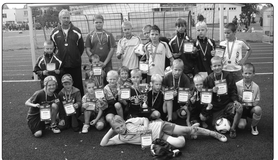
Zēnu futbola festivālā Staicelē – 3.vieta 3