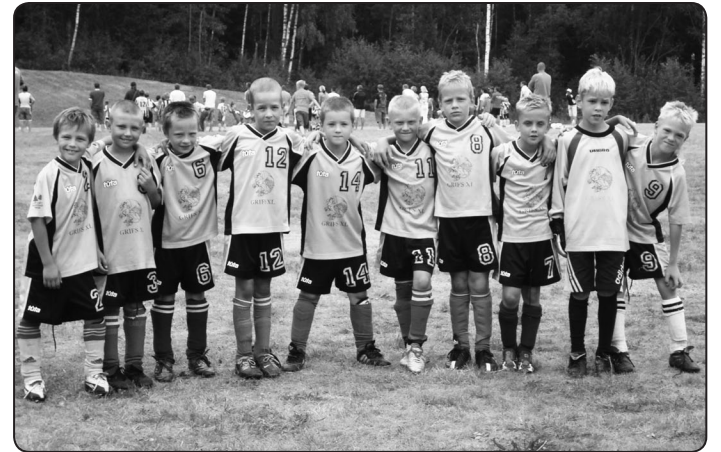
Valkas novada BJSS U-9 komanda Polvā