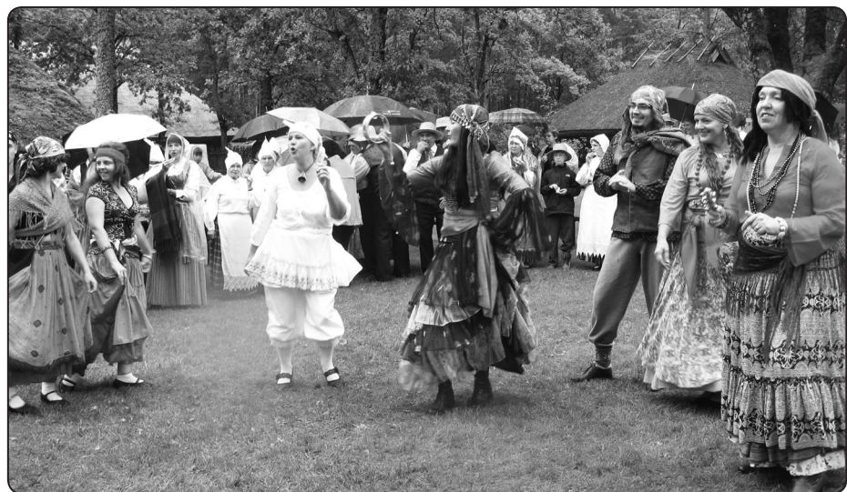
Īpašu jautrību rada nelūgtie viesi – kūjnīki