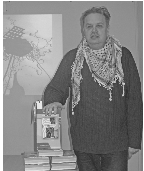
Vēl mirklis un arī valcēnieši varēs ceļot mākslas pasaulē.

Inguna Medne, Valkas novada domes sabiedrisko attiecību speciāliste