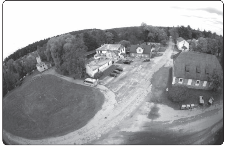
Vijciema centrs no putna lidojuma.

Nu beidzot šīs rūpes ir aiz muguras un varam ļauties sapņiem. Pirmā priecīgā ziņa – 13.septembrī saņēmām zvanu – Saeima galīgajā lēmumā pieņēma grozījumus likumā «Par valsts budžetu 2012.gadam», atbalstot papildus finansējumu vairāk kā 88 miljonu latu apmērā dažādiem prioritāriem pasākumiem, t.sk. 150 000 latu tika iedalīti Vijciema Tautas nama un pagasta pārvaldes ēkas atjaunošanai. No apdrošināšanas akciju sabiedrības «Balva» saņemta atlīdzība Ls 39 280,29. Ziedojumu kontā ar mērķi Vijciema tautas nama atjaunošanai saņemti Ls 1246,49. Šobrīd ir izsludināts iepirkuma konkurss «Vijciema tautas