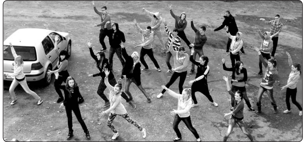
Jautrā un atraktīvā rīta vingrošana ar grieķu dejas soļiem un kustībām.

12. un 13.oktobrī 32 Latvijas awardieši tikās kārtējā saietā, šoreiz Valkā. Dažādu prasmju un deju apgušana, divu pierobežas pilsētu – Valkas un Valgas, iepazīšana ekspedīcijā, atraktīvas spēles un jautrība – tās ir galvenās vērtības, kas piesaistīja jauniešus šim Award pasākumam. Valkas awardieši, sadar-bībā ar Valkas novada Bērnu un jauniešu centra (BJC) «Mices» kolektīvu, tikšanās sāka plānot jau vasaras beigās un tāpēc visu iecerēto izdevās paveikt ļoti labi. Tālo ceļu uz Valku bija mērojuši jaunieši no Salaspils, Ogres un Alūksnes novada Bejas.