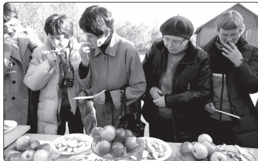
«Kurš ir vissaldākais un garšīgākais?»