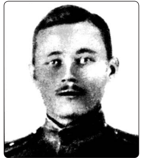
Jūliuss Balodis.