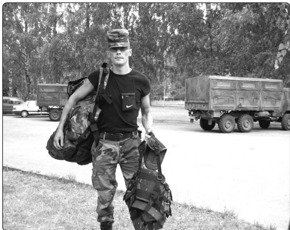
Pirms došanās uz mācībām Galgauskas poligonā.

lām. Astoniem Kocēnu pagasta maznodrošinātajiem iedzīvotājiem novads sagatavoja zemi, iedevām kartupeļu sēklu, viņiem tikai atlika kopt lauciņu un novākt ražu. Pieci no astoņiem ražu izaudzēja, viens no tiem jau pavasarī pievērsās «biznesam» – sēklu pārdeva. Tāda ir mūsu pieredze ar labdarību,» stāsta Rīvars.