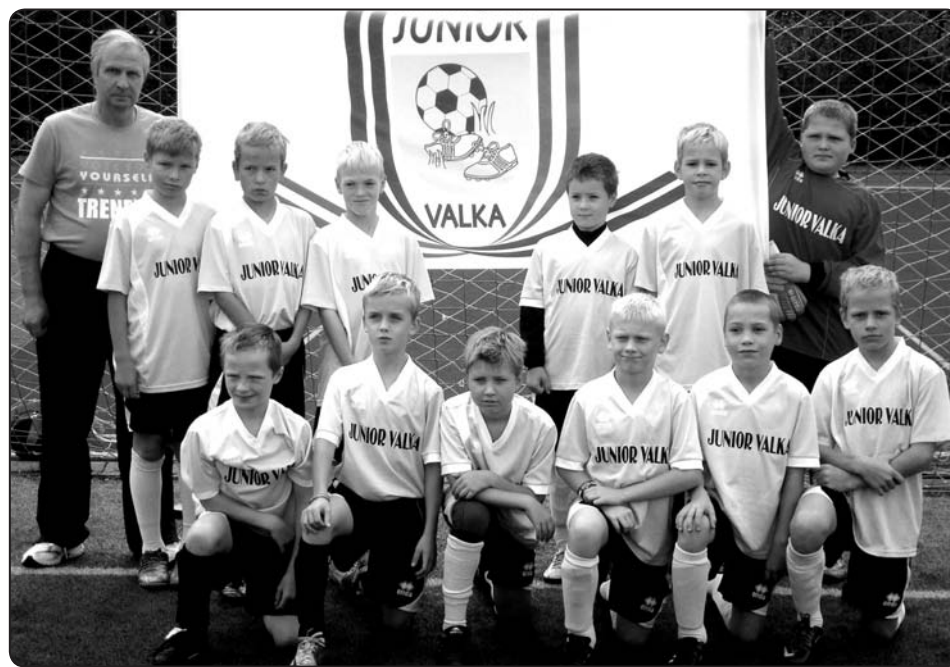
Valkas mazie futbolisti ļoti cer uz sabiedrības atbalstu.

Vasarā projekta laikā Valkas mazie futbolisti ieguva daudz jaunus draugus no citu pilsētu futbola klubiem. Turpinām sazināties, plānojam aicināt šos bērnus uz turnīru Valkā. Starp mūsu jaunajiem draugiem ir arī Latvijas izlases kapteinis Kaspars Gorkšs. Viņš ļoti pozitīvi vērtē to, ka mazpil-