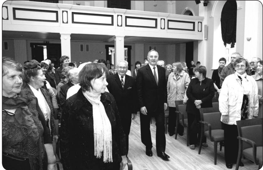
Iedzīvotāji ar patiesu interesi gaida tikšanos ar Valsts prezidentu Andri Bērziņu.