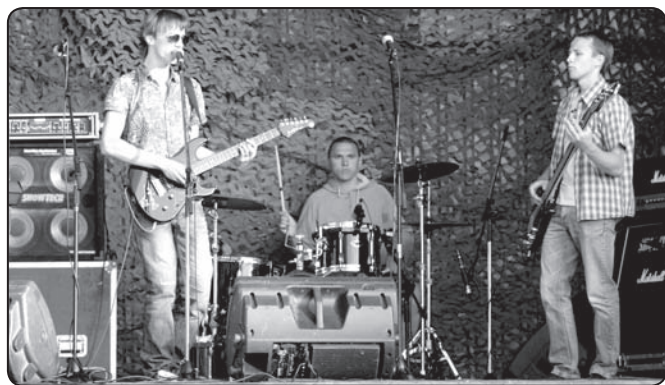
Rokskolas audzēkņu koncerts Valgas kara muzejā

BJMK Rokskola Valkā darbojas no 2011./2012.mācību gada, un to ir apmeklējuši 25 audzēkņi (t.sk. pieaugušie). BJMK Rokskola ir Ielgavā dibināta, akreditēta