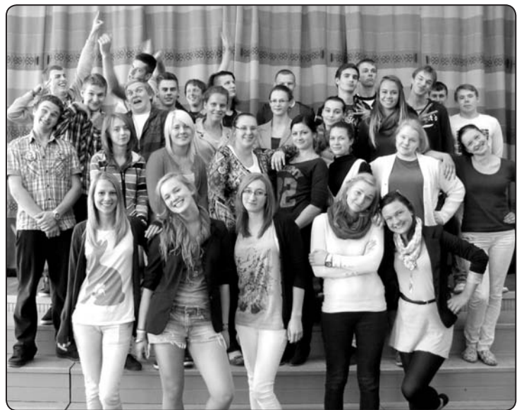
12.klases audzēkņi gatavojas atraktīvai Skolotāju dienai.

Šogad mēs, 12.klašu audzēkņi, ceram pārsteigt skolotājus ar vēl nebijušām