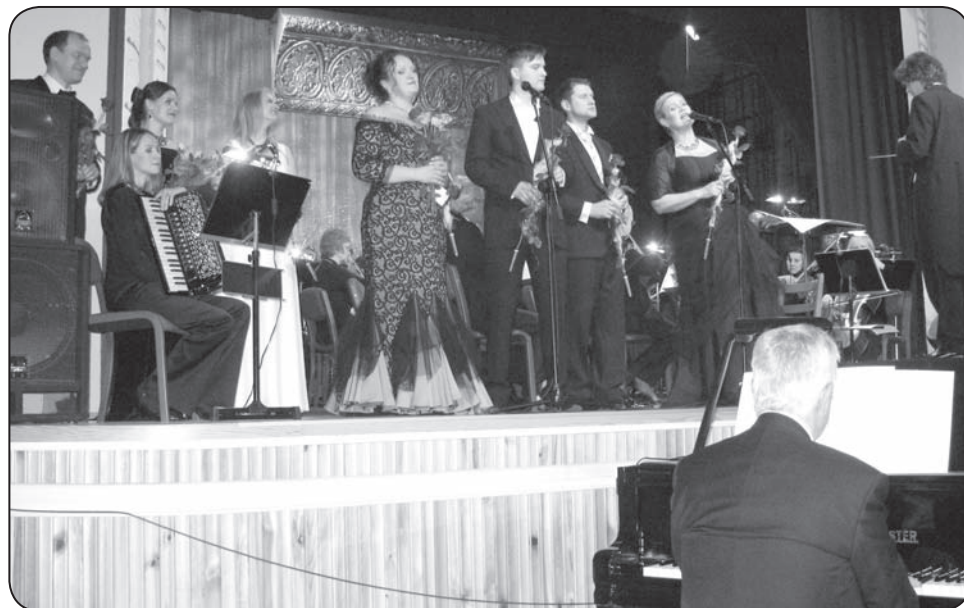
Operas svētki Valkā ir īpašs notikums, kas allaž sagādā prieku ne tikai skatītājiem, bet arī pašiem māksliniekiem

Skaistā tradīcija – ik gadu Valkas pilsētas kultūras namā sarīkot īstus operas svētkus, aizsākās 2003.gadā. Šobrīd cilvēkiem vēl vairāk kā agrāk ir nepieciešamas pozitīvas emocijas un