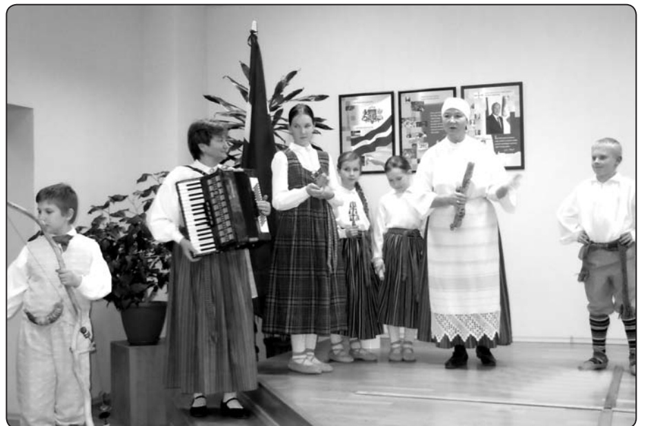
Folkloras kopa «Vainadziņš» kuplina valsts dzimšanas dienas svinības BJC «Mice».

Tā kā arī Lietuvas Republika 2013. gadā svin 95.gadadienu, notiks kopēji svētki – latviešu un lietuviešu tautas deju festivāls «Es dziedāju, gavilēju, uz robežas stāvēdama» vairākos Latvijas pierobežas novados.