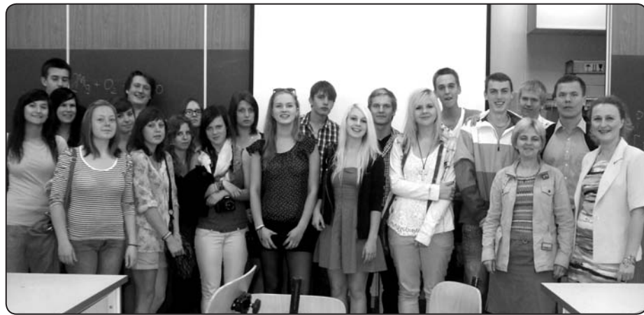
Valkas ģimnāzijas jaunieši un skolotāji pēc kopīgas ķīmijas stundas Gdaņskas licejā

Otrdien, 11.septembrī atkal devāmies uz skolu, kur pirmā stunda bija ķīmija. Tā notika angļiski, jo arī mūsu ikdienas saziņa bija angļu valodā. Pēc tam mēs, latviešu grupa, rādījām prezentācijas par savu valsti un skolu. Pat nodziedājām viņiem grupas «Apvedceļš» dziesmu «Zemenes». Pēc tam visi kopā devāmies uz Sopotas parku Olivā, kur