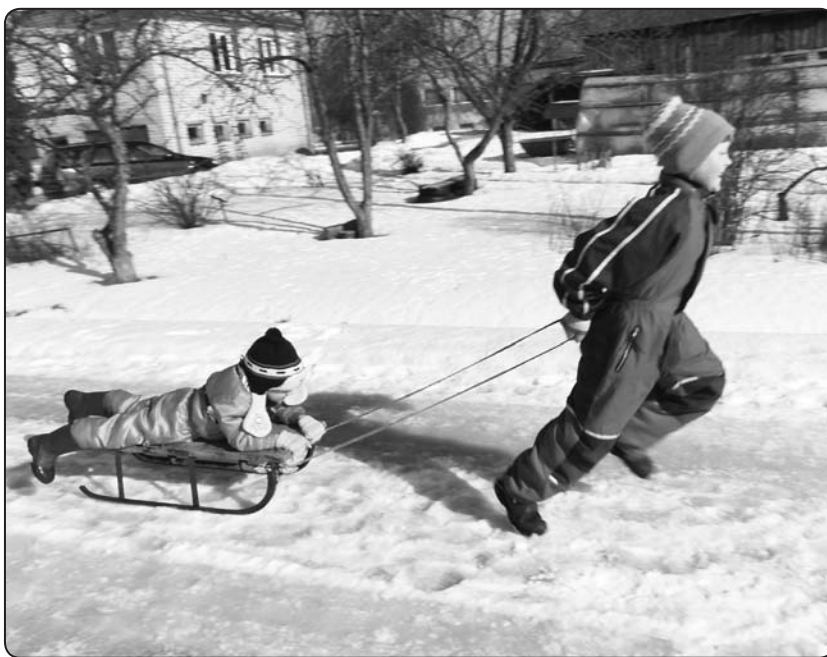
Ragaviņu vilkšanas sacensībās spēkus grib pārbaudīt ikkatrs

Ziemas sporta spēles bija lielisks veids kā pavadīt skaistu dienu kopā ar ģimeni un draugiem, izbaudīt ziemas priekus, sajūst sev apkārt skaisto dabu.