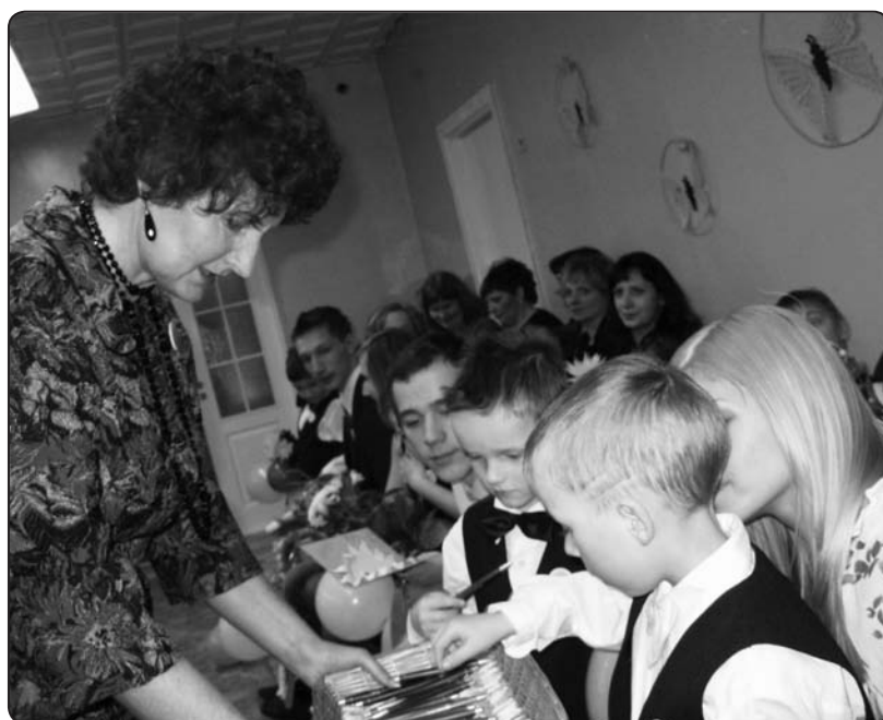
Nelielas un praktiskas veltes saņem ne tikai viesi, bet arī mājīnieki

salidojumā. Plānu un ieceru ir daudz, un daudzreiz tieši labas gribas palīgi palīdz tās īstenot. ❖