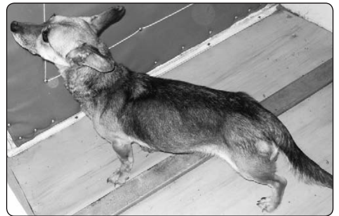
11.martā Kārķu pagasta «Smilgās» pieklidusi maza auguma, brūna suņu meitene, aptuveni 5 gadus veca