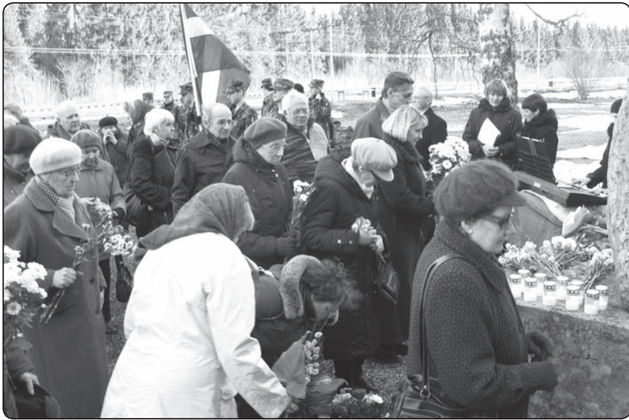
Pasākuma dalībnieki Lugažu stacijā noliek ziedus un aizdedz sviecītes