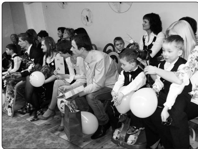
Nama iemītnieki ieklausās laba vēlējumos

«Mani raibie 18» patiešām ir bijuši tik raibi, cik vien iespējams. Tādēļ atmiņu pūrs ir gana bagāts un savus divdesmit gadus «Saulīte» plāno sagaidīt bijušo audzēkņu, darbinieku un labvēļu