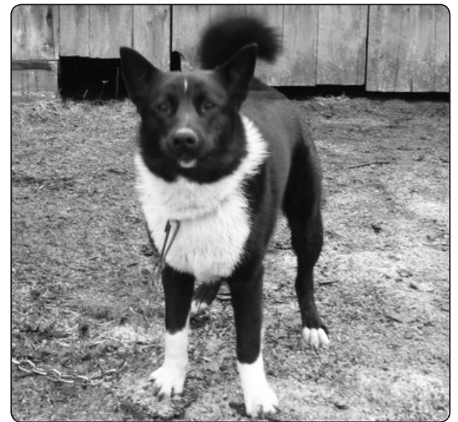
Pēc apmēram divu nedēļu klaiņošanas, Valkas pagasta mājās «Dimanti» pieklidīs melnbalts suns – laika, ar siksnīņu ap kaklu

Projektu pieteikumi jāiesniedz saskaņā ar VPR noteiktajiem termiņiem VPR birojā personīgi vai jānosūta pa pastu (ar noteikumu, ka pasta zīmogs ir piecas dienas pirms konkursa beigu termiņa). Adrese – Vidzemes plānošanas reģions, Jāņa Poruka ielā 8 – 108, Cēsis, LV 4101.