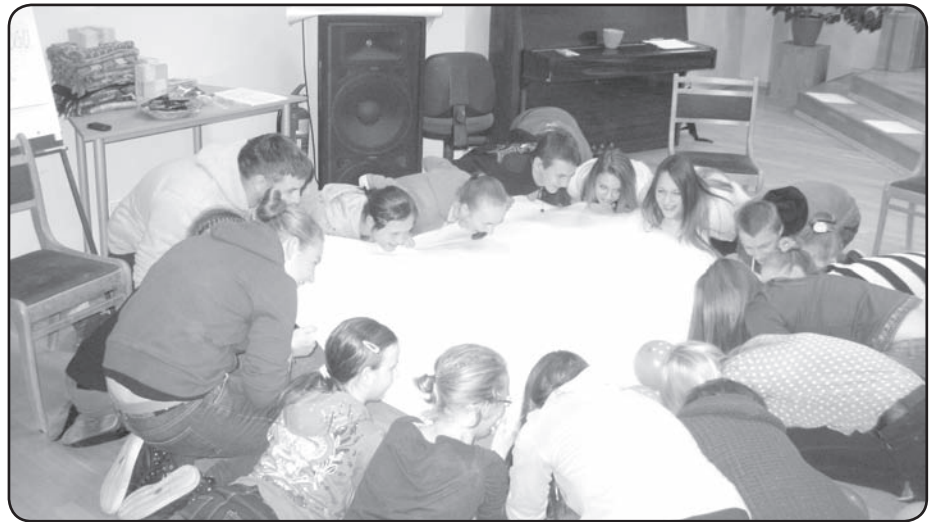
Pasākuma kulminācija – «Līdzdalības picas» kopīga pagatavošana

Dienas galvenais ieguvums ir visu novada skolu līderu iepazīšanās un vēlēšanās arī turpmāk satikties un sadarboties. ❖