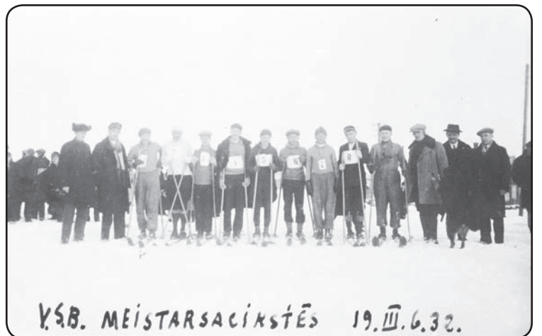
VSB slēpošanas meistaršacīkšu dalībnieki. Valka, 1932.gads