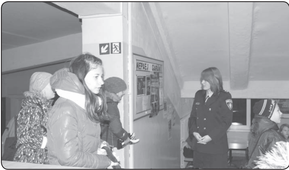
Lai ceļš uz skolu būtu drošs, jālieto atstarotāji

Abas aktivitātes rīkoja skolas padome. ❖