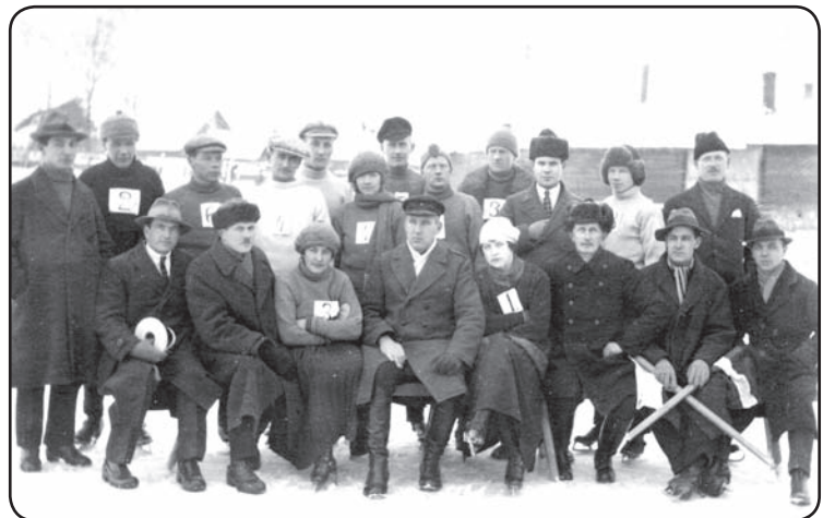
Slidošanas sacīkšu dalībnieki. Valka, 1930.-tie gadi