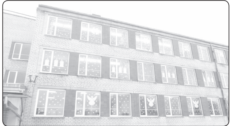
Bērni ar vecāku atbalstu izgaismo Valkas pamatskolas ēku

Teksts: Gita Dreijere, Sintija Podniece, Inese Varesa, foto Ziedonis Pētersons