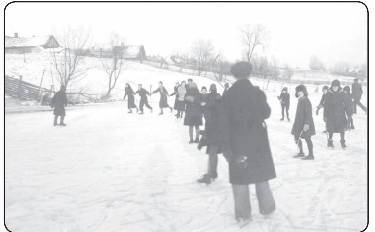
Slidotāji uz Pedeles upes. Valka, 1931.gads

Aktivitātes ziemā saistītas ne tikai ar sportu, bet arī ar jauku ziemas ainavu baudīšanu un jautrību gan bērnu, gan pieaugušo vidū. ❖