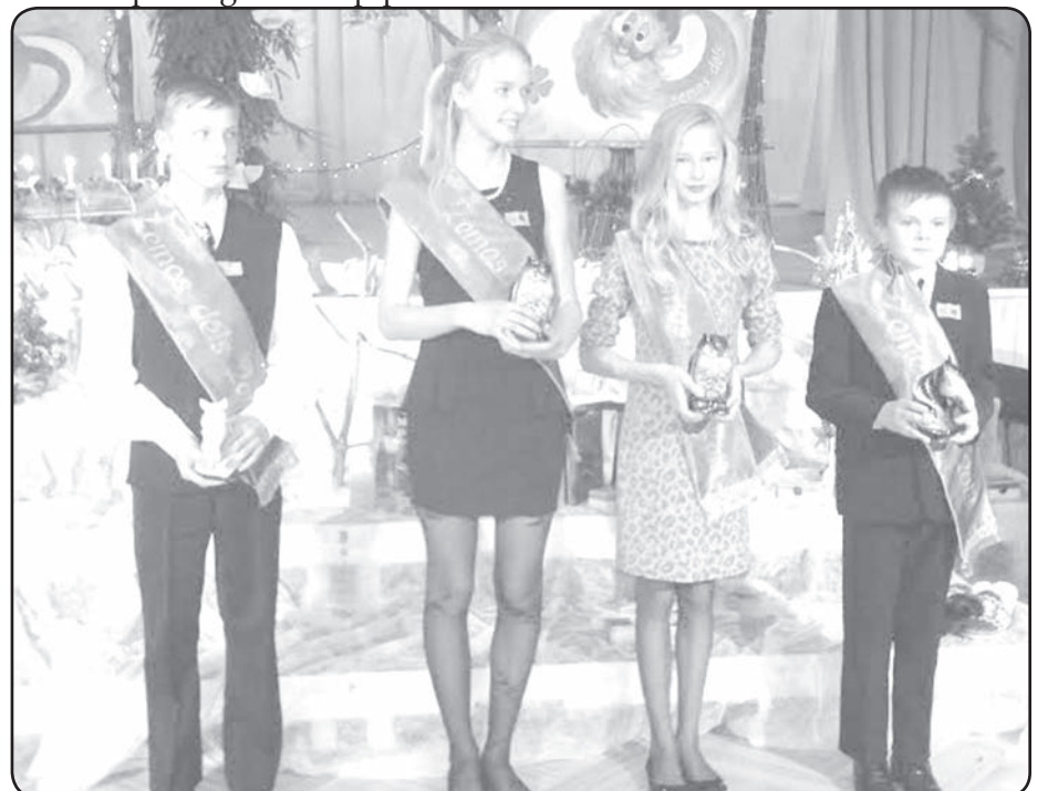
Mazpulcēni saņem apbalvojumus

Svētki noslēdzās, kā jau dzimšanas dienā klājas, – ar milzīgu torti, kliņģeri un mājiņu sarūpētu gardu cienastu. ❖