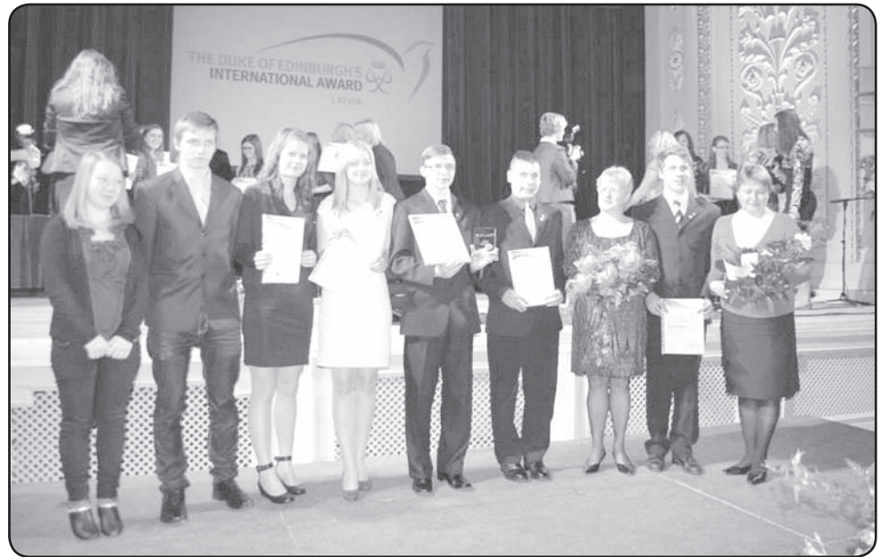
Valkas jaunieši saņem «Award» apbalvojumus