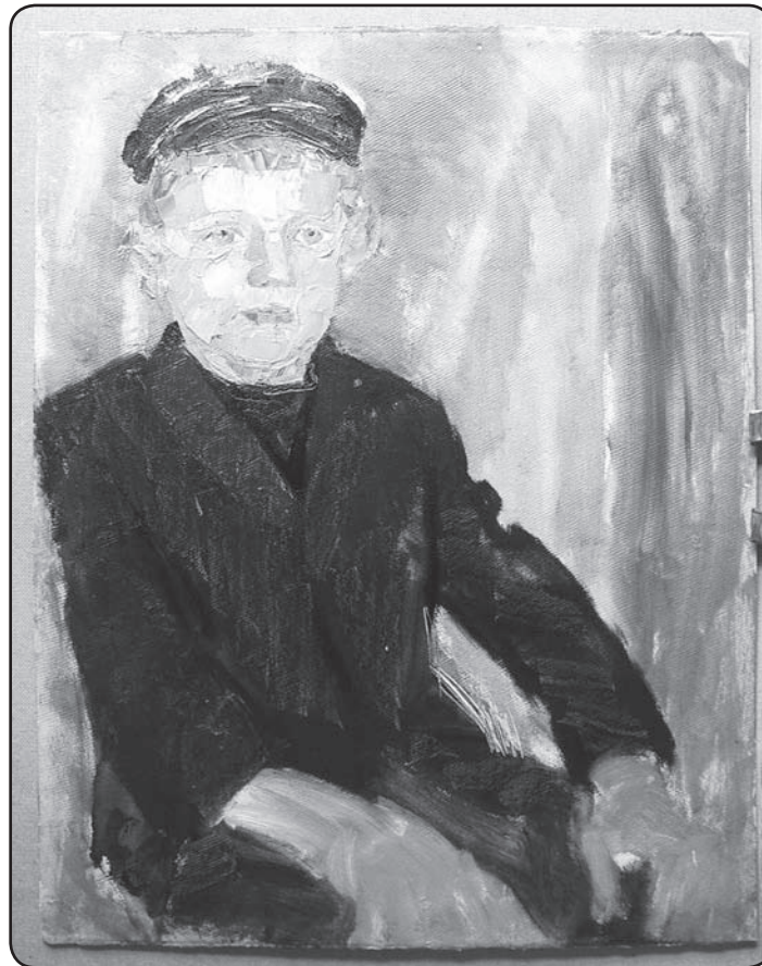
VkNM InvN 12047 «Zēna portrets» pēc restaurācijas