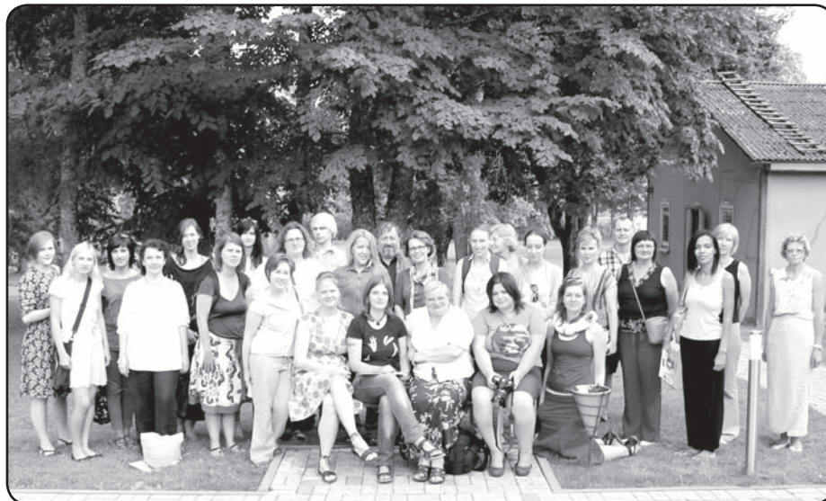
Ekspedīcijas dalībnieku (lielākoties Rīgas daļas) kopbilde

Kā viens no pozitīvākajiem ekspē-dīcijas ieguvumiem ir vietējo Valkas skolēnu piedalīšanās, kas viņiem pavēra pavisam citu skatu uz vietu, kur viņi dzīvo un pavada dienu no dienas, pat neiedomāju-šies, ka katrs cilvēks, sastapts uz ie-las, redzēts veikalā, mājas pagal-mā, slēpj savu dārgumu daļu. Šie stāsti par mums pašiem, par pie-