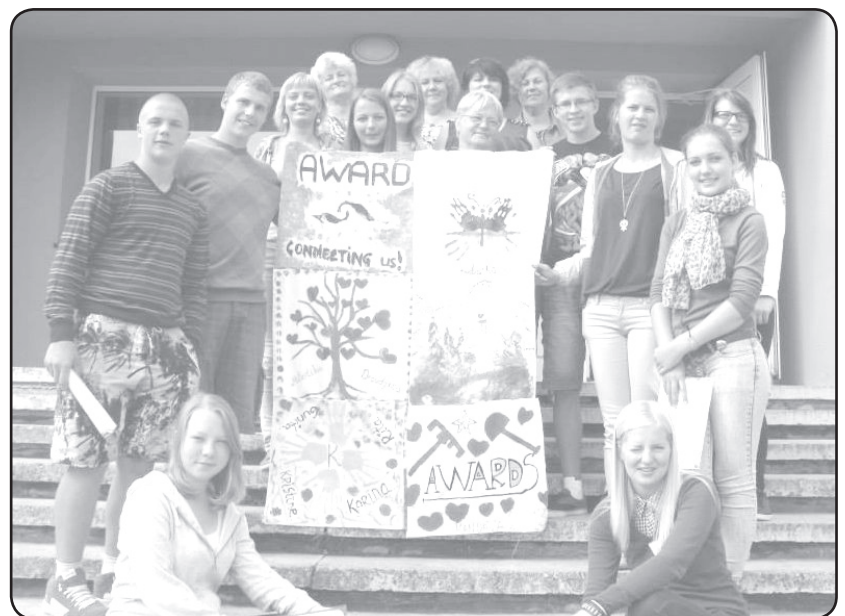
Valkas avardieši ir lepnī par savu nometnes karogu

Kaut arī tā bija pēdējā augusta nedēļa, tomēr māte daba mūs lutināja ar siltu saulīti. Tvērām pēdējās peldēšanās sezonas dienas, kā arī piedzīvojām pamatīgu ūdens kariņu! ❖