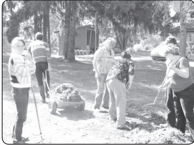
Kopīgiem spēkiem tiek attīrīts volejbola laukums