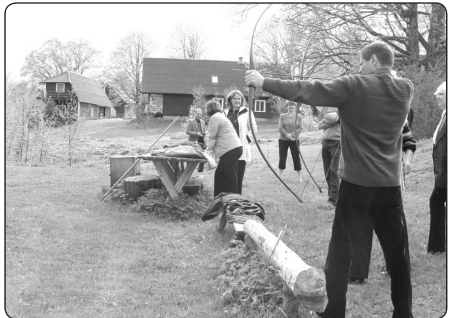
Trāpīt mērķi sportā un dzīvē – tas ir veiksmes pamats