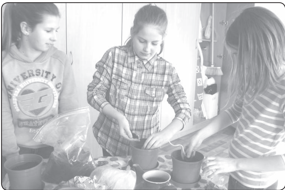
Rudens forumā mazpulcēni varēs izvērtēt - kāda ir bijusi šī gada raža

Teksts: Vita Kalvāne, Valkas novada BJC «Mice» direktore