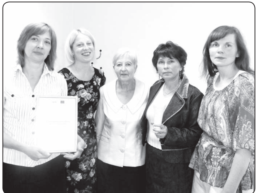
Valkas novada Sociālais dienests saņēma pateicību par veiksmīgu sadarbību projekta īstenošanā

Izveidota Vidzemes reģiona e-pakalpojumu vietne www.resursu-centrs.lv , apkopota un regulāri aktualizēta informācija par projektā iesaistītajās pašvaldībās sniegtajiem sociālajiem pakalpojumiem, sniegtas 134 individuālās konsultācijas e-vietnē. ❖