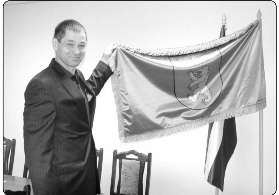
Patriotisms un lepnums par novadu ir vajadzīgs ikvienam, kurš strādā pašvaldības darbā