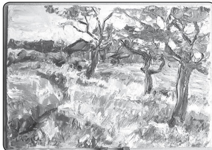
VkNM InvN 12036 «Vējavas «Skrandu» saimniecības ēkas» pēc restaurācijas