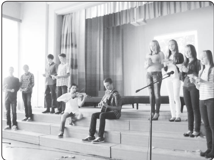
8.klases ansamblis Vecāku kopsapulcē dzied dziesmu dāņu valodā