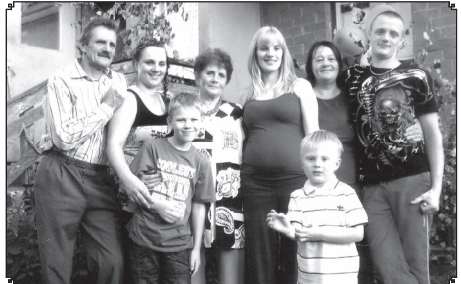
Gaida ar saviem tuvajiem.