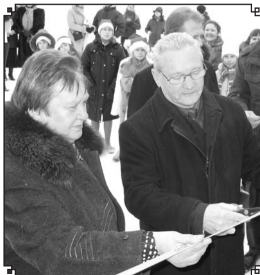
Kārķu sporta zāles atklāšana – nozīmīgs ieguldījums pagasta sporta dzīves attīstībā un pagasta infrastruktūras sakārtošanā.