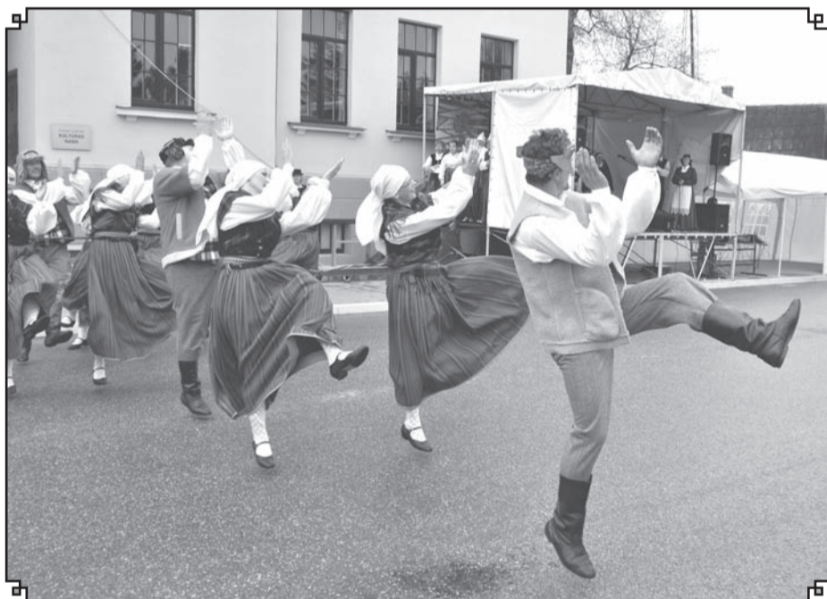
Robežtirgus apmeklētājus ar savu atraktīvo priekšnesumu priecē dziesmu un deju svētku dalībnieki – deju kopa «Aija»