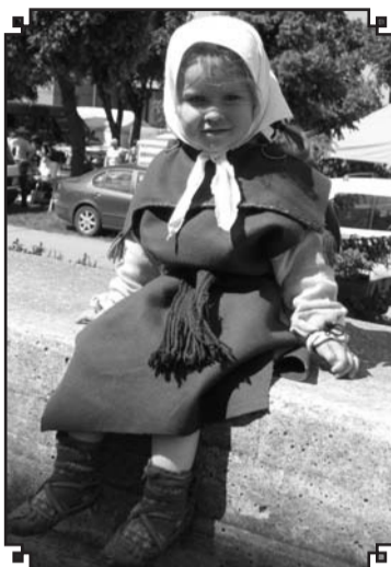
Turpinājums no 4.lpp.

meitenes. Komandā 7 spēlētāji, uz laukuma 5+1.