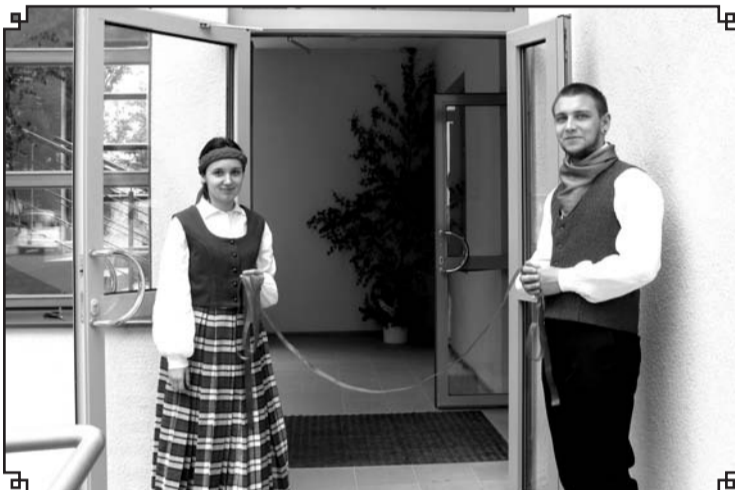
Līdz ar Saieta nama «Lugažu muiža» atklāšanu, Valkas pagastā sākās ļoti aktīva kultūras dzīve.

posms ir izbūvēts, tam seko nākamais. Tā esam domājuši un darījuši šajos gados.