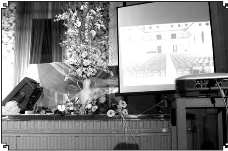
Valkas pilsētas kultūras nama zāles un foajē atklāšana pēc renovācijas bija ilgi gaidīts nama darbinieku un valcēniešu sapnis.

Katrs īstenotais projekts un padarīts darbs nebeidzas, tas turpinās tādā vai citādā veidā. Ja kāda ēka ir uzcelta, tā jāpiepilda ar cilvēkiem un viņu darbošanās gribu. Ja kāds infrastruktūras objektu virknes pirmais