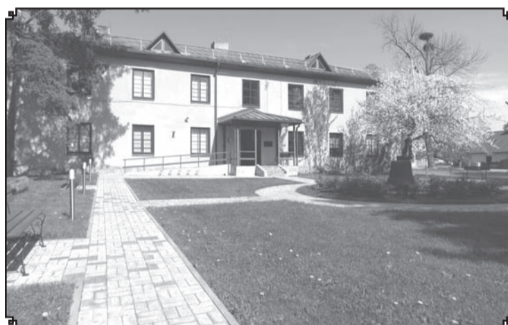
2013.gada maijā.