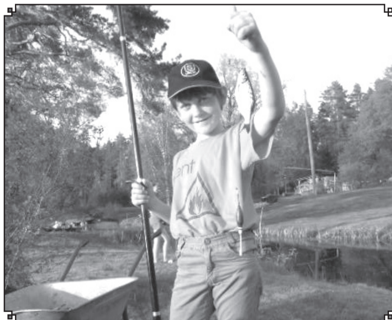
Makšķerēšana ir laba nodarbe jebkurā vecumā, un patīkami, ja izdodas noķert zivtiņas savām pusdienām