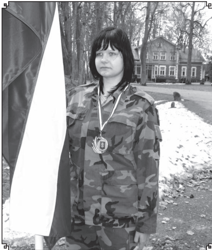
Siva cīņa, sudraba medaļa, diploms, karoga godasardze – tā ir spēcīga adrenalīna un emociju deva