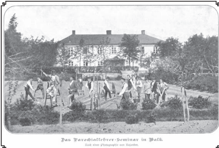
Semināra audzēkņi dārza darbos. Apt. 1880.g. No grāmatas «Das ritterschaftliche Parochiallehrer-Seminar in Valk»