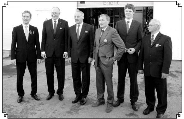
Viens no 2012.gada nozīmīgākajiem notikumiem bija – jaunās Enefit koģenerācijas spēkstacijas atklāšana Valkā.

Visi gaidām vēlēšanas 1.jūnijā. Tātad – tuvā nākotne būs sākusies. Kopā strādāt būs jāsāk jaunajiem do-