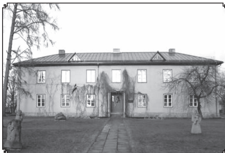
2007.gada decembrī.