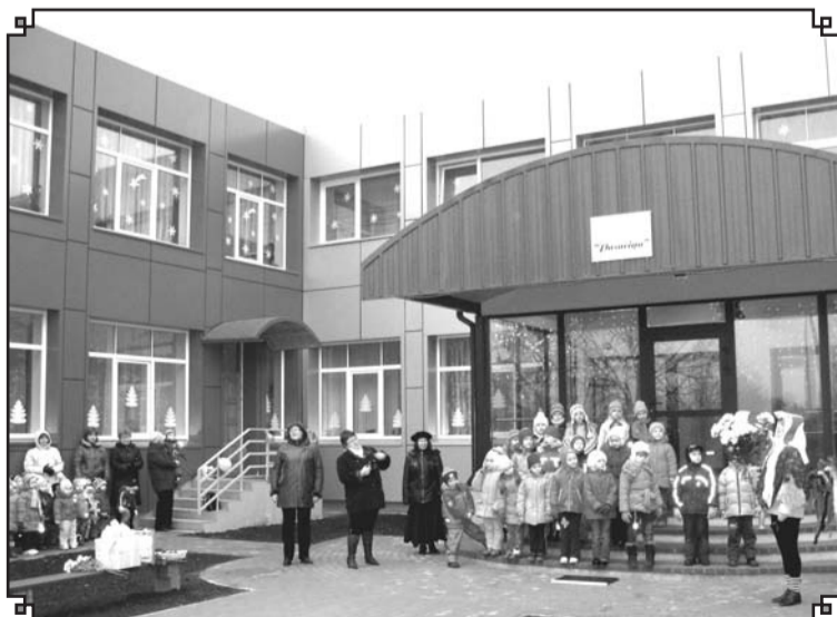
PII «Pasaciņa» ir viens no pirmajiem renovētajiem objektiem novadā, kas priecē bērnus un padara košāku pilsētvidi.