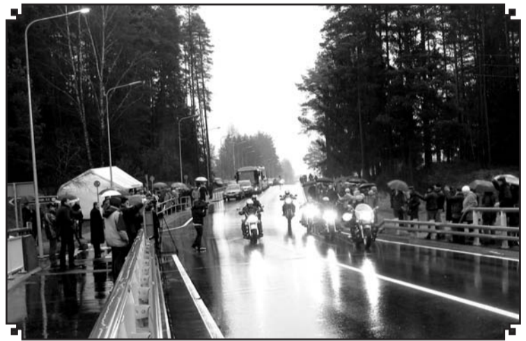
Pēc vērienīgiem remontdarbiem satiksmei atklāts jaunais tranzītmāršruts Valkā.

mes deputātiem. No sirds novēlu nolikt malā politiskās ambīcijas un, kopīgi risinot problēmas, meklējot un atrodot labāko, vajadzīgāko savam novadam, tā cilvēkiem, darboties komandā. Jārod sadarbība ar valdību, Saeimu, Pašvaldi-