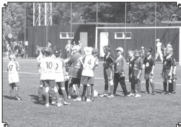
Valkas novada sporta skolas U – 9 futbolisti pirms spēles ar Rīgas «Dinamo» komandu

talurga» un FC Ventspils komandām. Diena izvērtās gara un nogurdinoša, tomēr visi bija priecīgi. ❖