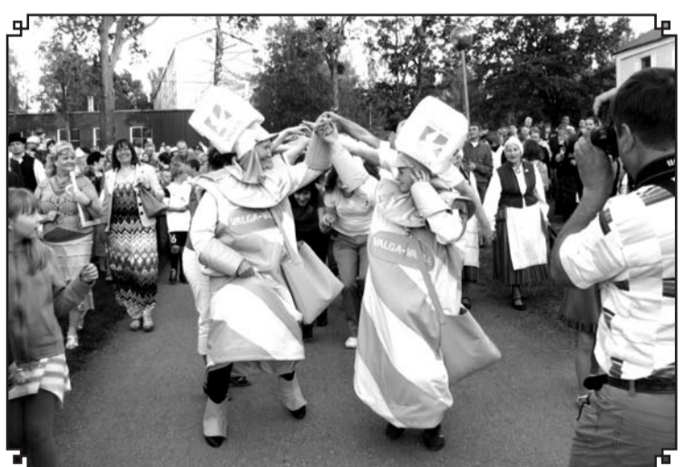
Valgas un Valkas talismani – robežstabi Peeter un Pēteris, ir neiztrūkstošs elements pilsētu svētkos.

• plkst. 19:30 – 04:00 Lielā Roka nakts Valkas brīvda-