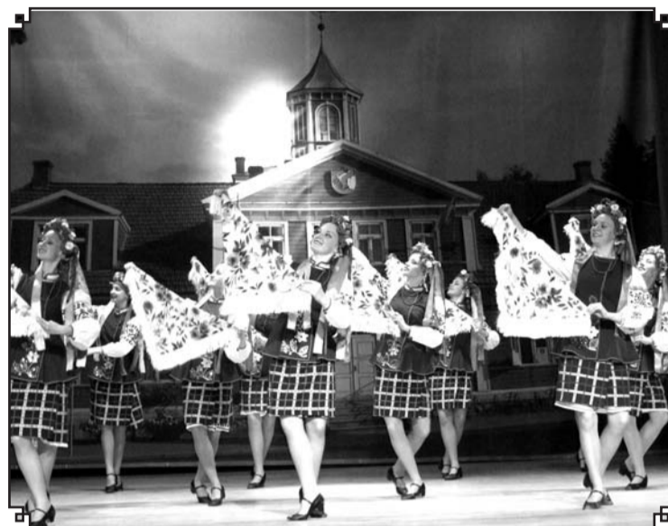
Koncerts pagājušā gada pilsētas svētkos bija lieliska iespēja priecāties par krāšņiem tērpiem, nevainojamiem dejas soļiem un iepazīt dažādu tautu kultūru.

• plkst. 10:00 svinīgais pil-sētas maršs Valgā. Kolonā soļos Zemessardzes Valgas vienības orķestris, jaunsar-gi no zēnu organizācijas «Noored Kotkad» un meiteņu