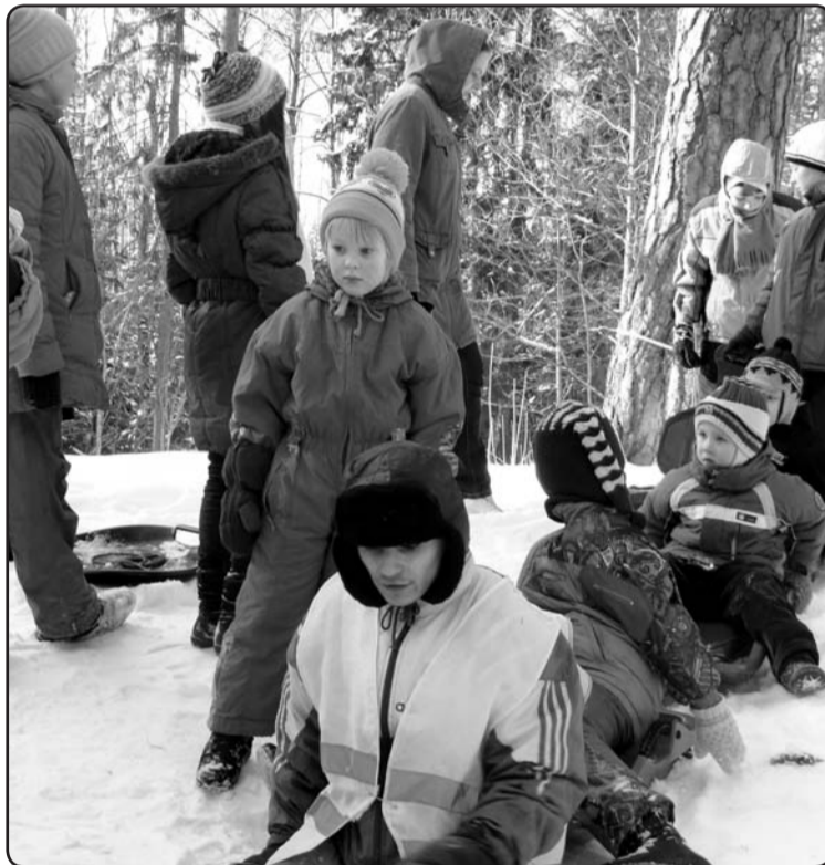
Startam gatavi – kurš aizbrauks vistālāk?