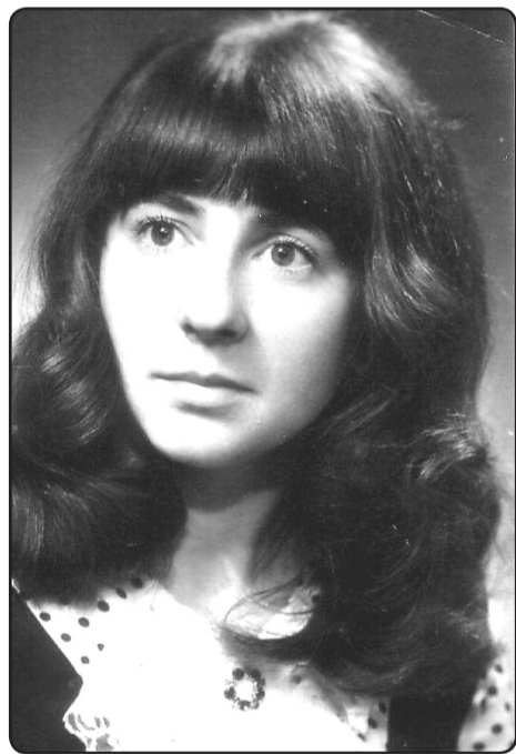
Elga tehnikuma laikā