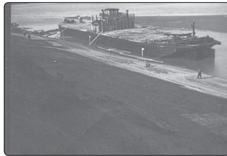
Izsūtīto latviešu būvētā barža liellaiva (barža). Baturina, 1950.gadu sāk. – VKNM InvN 23927