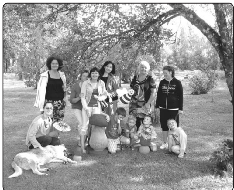
Ērgemes bērnu nama bērni un skolotāji pie Elgas laukos ekskursijā «Par un ap bitēm», 2012.g.vasarā