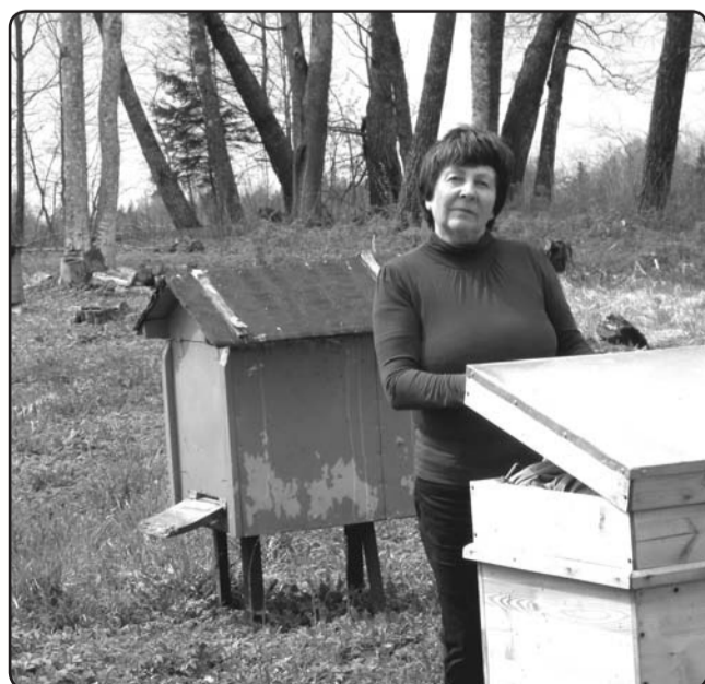
Elga pavasarī savā bišu dravā