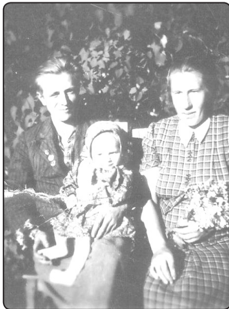
Elga ar vecākiem