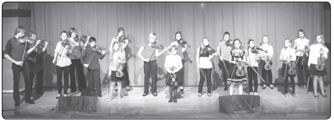
Viens no skolas leņņumiem ir vijolnieku ansamblis, kas ar savu sniegumu nevienu neatstāj vienaldzīgu.