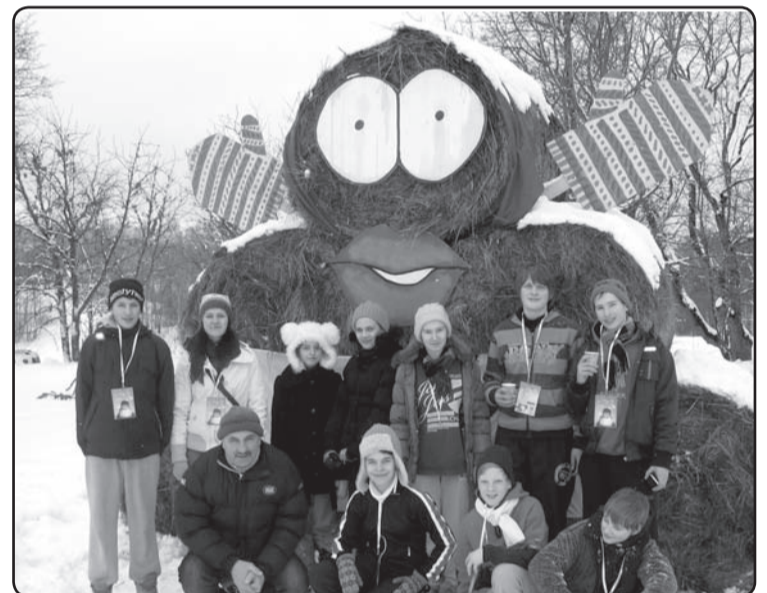
Vijciemiešu komanda Latvijas jaunatnes ziemas olimpiādē Ērgļos.