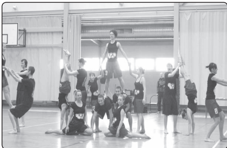
Viens no atraktīvākajiem un gaidītākajiem pavasara notikumiem ģimnāzijā ir tradicionālais vingrošanas festivāls «Vingro vesels».