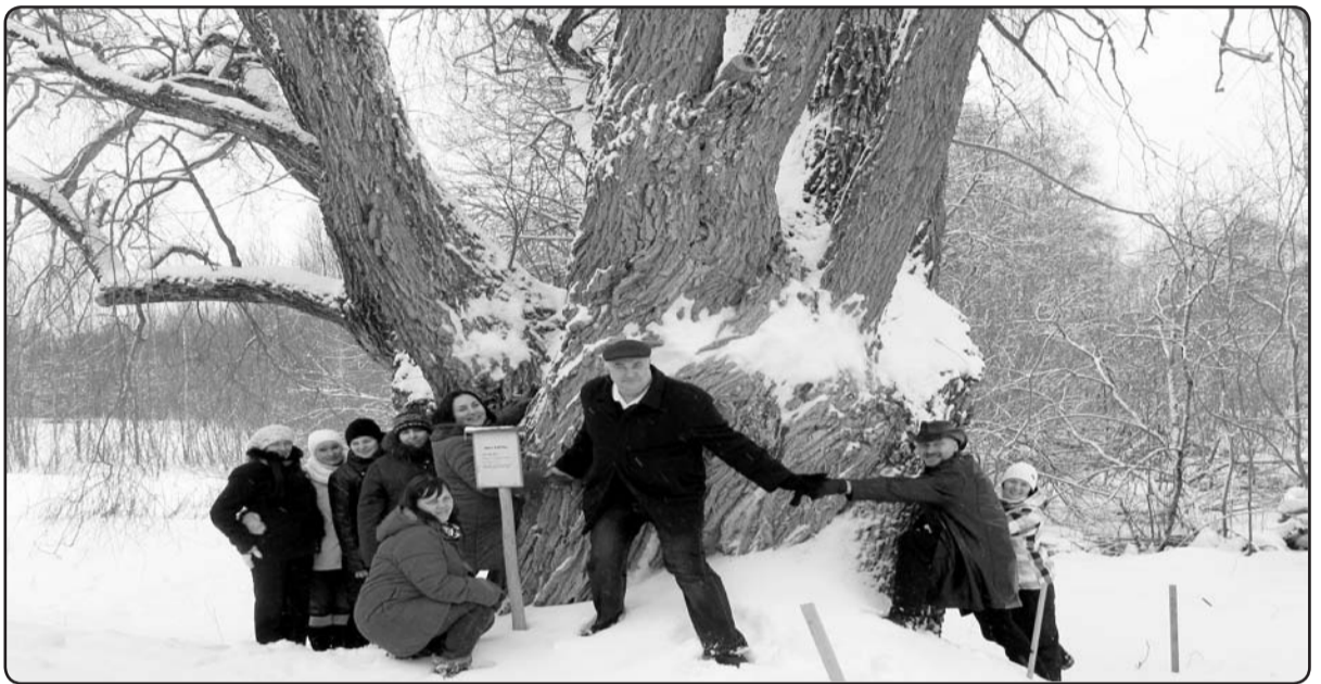
Ikviena iedzīvotāja un uzņēmēja sapnis – lai mūsu novads būtu stiprs, kupls un izturīgs. Valkas novada tūrisma uzņēmēji un novada domes speciālisti pie Nagļu dižvītola Kārķos.

«Esmu gandarīta, ka pasākums izdevās un visi ir apmierināti. Personīgi man vislielākais prieks ir par sastaptajiem cilvēkiem un viņu darbu. Novadam ir jāsekmē savstarpēja informā-