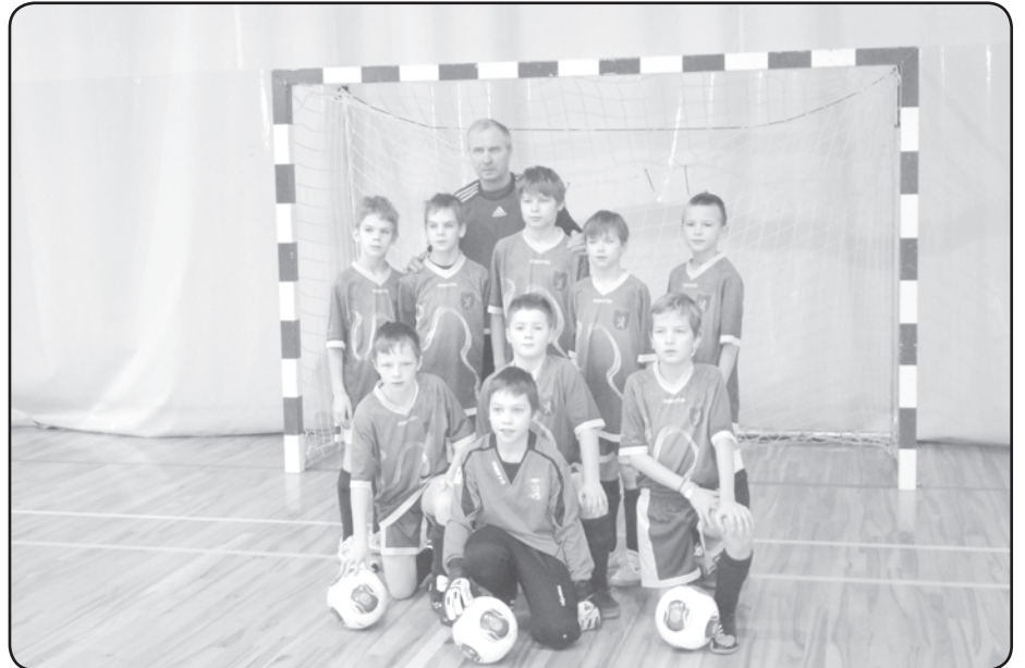
U-11 komanda viesos Igaunijas pilsētā Suure-Jaani

23.februārī U-12 komandas (šajā vecuma grupā Valkas novada BJSS startē ar divām komandām) izspēlēja savus finālus Vidzemes ziemas čempionātā. Valkas BJSS pirmā komanda Allažos izspēlēja A finālu. Pirmie pretinieki bija FC Merkur-Junior no Tartu. Igaunijas komanda bija ātra un tehniska, valcēnieši pretī lika cīņassparu. Spēle aizritēja ar Tartu komandas nelielu pārsvaru, mūsējie atbildēja ar pretuzbrukumiem. Diemžēl no tām iespējām, ko izveidojām, nepratām gūt vārtus, pretinieki vienā no uzbrukumiem pārspēja mūsu vārtsargu. Rezultātā zaudējums. Arī otrajā spēlē ar vārtu gūšanu mums neveicās; no daudzajiem izveidotajiem momentiem mūsu komandas uzbrucēji nevienu reizi neprata gūt vārtus, arī šajā spēlē piedzīvots zaudējums. Trešajā spēlē nospēlēts 1:1 ar Jaunpiebalgas komandu. Cīņā pa 5 – 8.vietu sāpīgs zaudējums Valmieras otrajai komandai. Tikai turnīra pēdējā spēlē Valkas komanda veiksmīgi spēlēja un rezultātā pārliecinoši uzvara pār FK Super Nova/Sigulda ar 5:0. Komandā daži spēlētāji aizrāvās ar individuālo spēli, kas zināmā mērā arī traucēja reali-