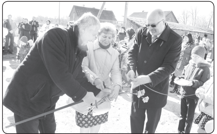
Svinīgā sarkanās lentas pārgriešana, atklājot Ērgemes pagasta Omulu bibliotēkas remontētās telpas