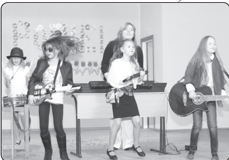
Pasākumu «Popiela» tēma šogad bija – mīlestība, romantika, draudzība

3.vieta 4.d klasei Rednex «Cotton eye joe» .