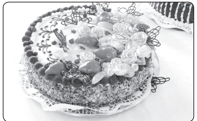
1.Kūku konkursā varēja nogaršot 19 dažādas mājās ceptas tortes, kuras bija izcepuši 17 konkursa dalībnieki