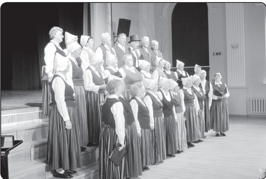
Valkas senioru koris turpmāk nesīs vārdu «Dziesmu rota»

26.aprīlī Valkā sabrauks Latvijas senioru viendabīgie un jauktie vokālie ansambļi, lai piedalītos II Latvijas Senioru vokālo ansambļu konkursā, kas sāksies plkst. 12.00 Valkas kultūras namā. Konkursa mērķis ir sekmēt senioru aktīvu un radošu līdzdalību Latvijas kultūras procesā, noteikt labākos seni-