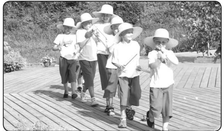
Mazie Ērgemieši pirmie iemēģina skatuves grīdu peldvietas atklāšanas pasākumā.