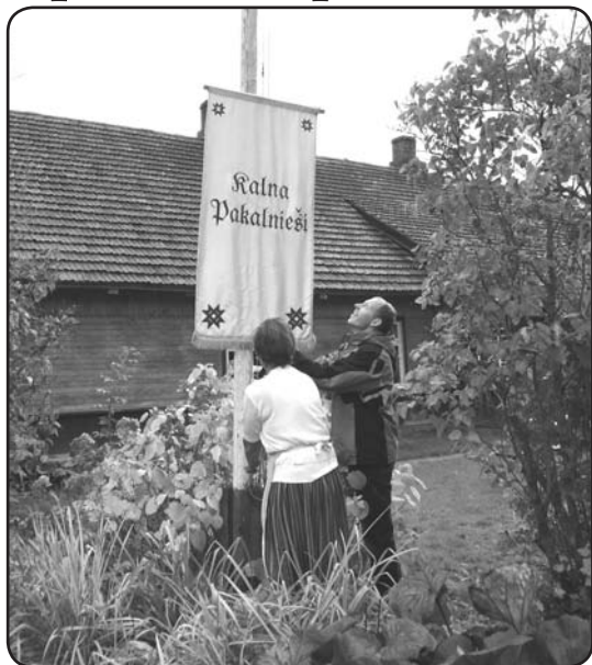
Pieredzes apmaiņas braucienu novada lauku attīstības speciālisti un zemnieki Gulbenes novadā sāka ar karoga pacelšanu «Kalna Pakalniēšu» mājā.

Konsultēti lauksaimnieki par pieejamo valsts un Eiropas Savienības atbalstu lauksaimniekiem.