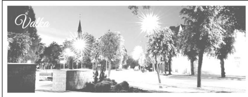
Valkas novada Tūrisma informācijas birojs, atsaucoties uz daudzajiem iedzīvotāju ierosinājumiem, izstrādājis jaunas pastkartes, grāmatzīmes – kalendārus 2014.gadam un puzzle ar Valkas pilsētas un Valkas novada attēliem. Publicitātes foto.

Salīdzinājumā ar iepriekšējo gadu vidējais apmeklētāju skaits Valkas novada tūrisma informācijas birojā ir bijis līdzīgs, bet ar katru gadu kopumā vērojama augšupejoša tendence. Lielākā tūristu grupa ir no Latvijas, otra būtiska apmeklētāju grupa ir ceļotāji no Igaunijas, pēc tam citi ārzemju ceļotāji no Vācijas, Somijas, Francijas, Nīderlandes, Lielbritānijas, Dānijas, Zviedrijas, Beļģijas, Čehijas, Polijas, Itālijas, Izraēlas, Ungārijas, Spānijas, Lietuvas, Krievijas, Ukrainas. Nereti tūrisma birojā iegriežas arī interesenti no Kanādas, ASV un pat no Japānas, Austrālijas, Jaunzēlandes, Indijas, Vjetnamas, Korejas un Uzbekistānas.