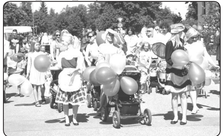
Pagājušā gadā otro reizi Valkas pilsētas svētku ietvaros notika LIELĀ RATU PARĀDE, kuras organizēšanā piedalījās arī Dzimtsarakstu nodaļa.

Pērn jau otro reizi īstenojām mūsu jaunumu – par godu Starptautiskajai ģimenes dienai BEZMAKSAS SVINĪGO LAULĪBU CEREMONIJU. Jaunajiem pāriem nebija jāmaksā par svinīgo ceremoniju, bet tikai valsts nodeva – pieci lati, un šī bezmaksas laulību «akcija» paredzēta pāriem, kuri nevēlas vai nevar atļauties rīkot lielas kāzas ar daudziem vie-