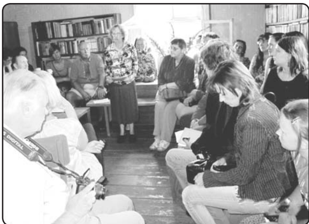
Šogad «Velgas dienas» pasākums pulcēja ļoti daudz apmeklētāju.