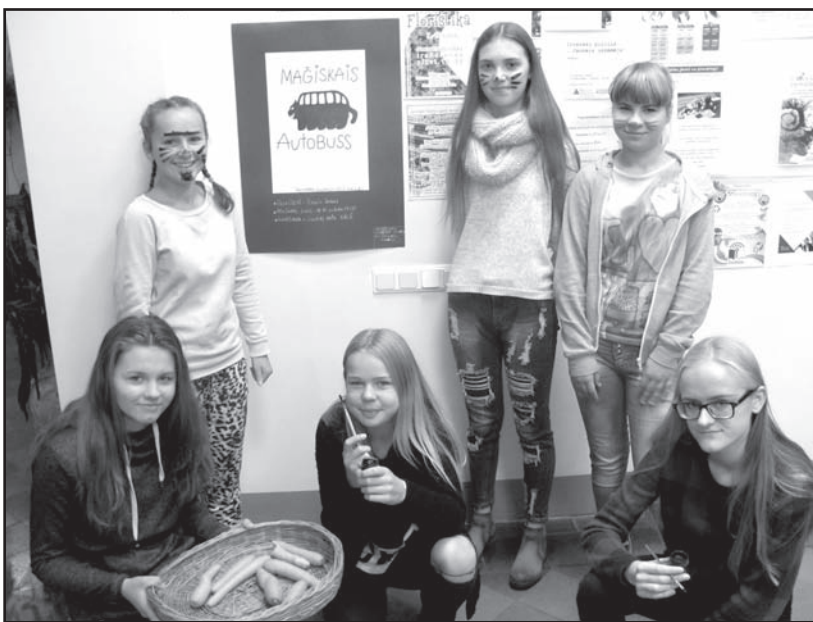
19. oktobra rītā visi 7. klašu skolēniem tika krāsotas sejas kā zaķēniem, jo iesvētību tēma «Maģiskais autobuss» to pavisam noteikti atļāva. Kurš gan nezina, ka autobusā kādreiz gadās «braukt par zaķi».

Vairāk informācijas var saņemt pie dienesta vadītājas – 29452453 vai 63725939. ☎