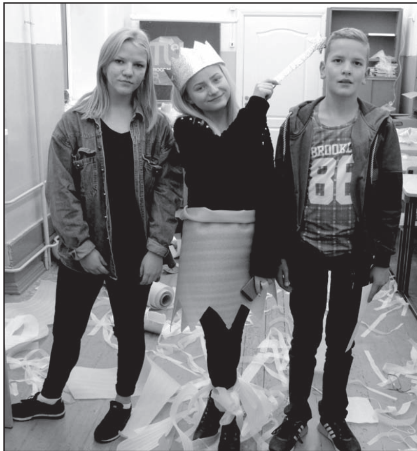
Stacijā «Valkas modes», kur 7. klašu skolēniem vajadzēja veidot sapņu skolas formas.