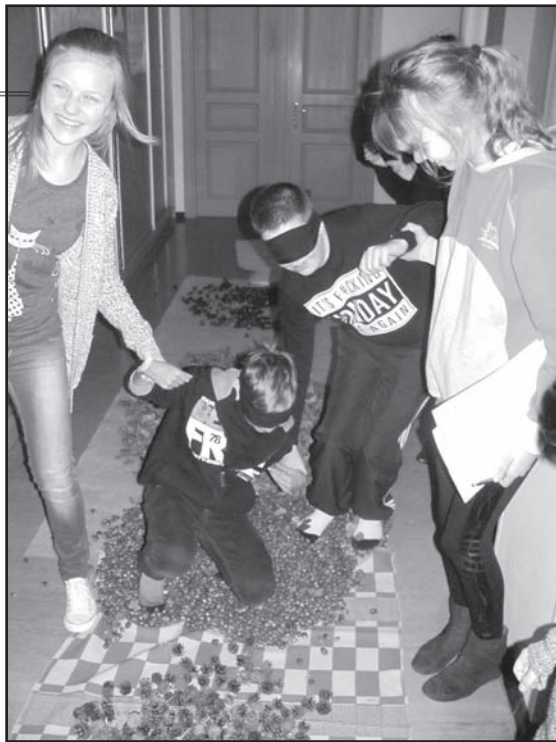
Stacijā «Sajūtu taka».

10. klašu skolēniem pasākums notika komandās, vairākās skolas un skolas apkārtnes vietās bija jāizpilda uzdevumi, kas bija atjautības un veiklības kopsavilkums. Visvairāk emociju desmitie izdzīvoja stacijās «Ūdens un ola» un «Dzēriens ar piedevu», jo vienpadsmitie bija ļoti izdomājuši, kā panākt, lai visi izpilda sīkākās norādes.