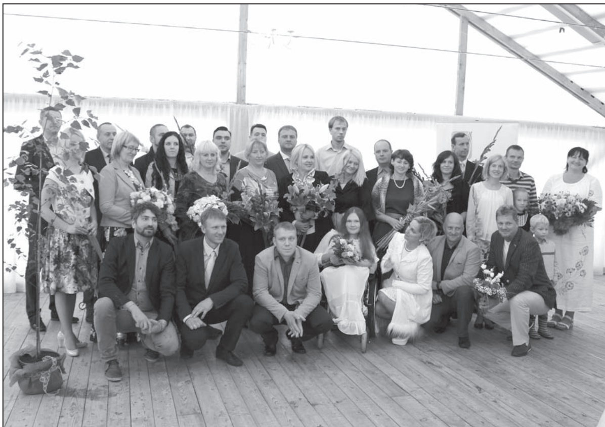
Šogad tika godināti 26 Vidzemes veiksmes stāstu varoņi: uzņēmīgi, neatlaidīgi, darbīgi un veiksmīgi ļaudis no visa Vidzemes reģiona.