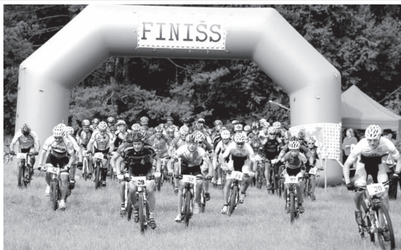
Aiziet! Starts tika dots pieaugušajiem uz 42 km garo distanci.

Pārējos rezultātus var apskatīt: www.valka.lv