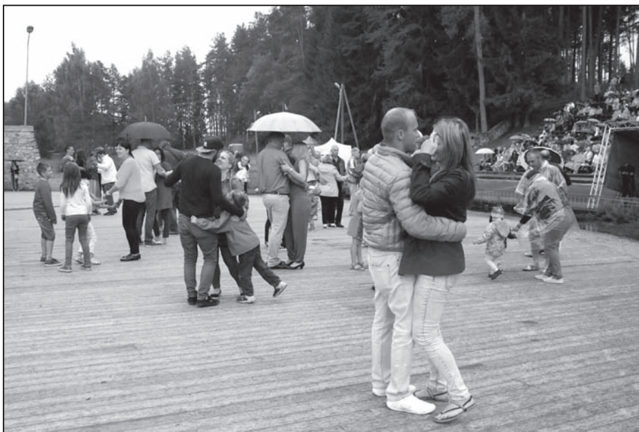
Valkas brīvdabas estrādē skatītāji no savām sēdvietām steidzās uz dejas laukumu tad, kad uzstājās tādas atraktīvas grupas kā «Rock'n'Berries», «Meln uz Balta», «Kokteilis», «Mākoņstūmēji»