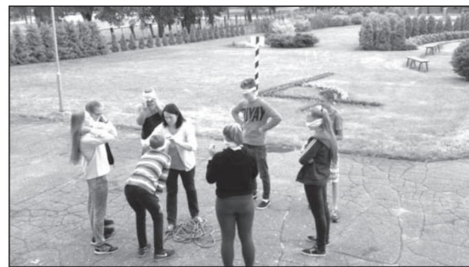
Valkas novada jaunieši piedalījās Valsts Jaunatnes programmas atbalstītajā projektā «Pašizaugsmes domnīca – Es to varu!»

Radošajā meistardarbnīcā – «Mana ideja – mans business» jaunieši pārrunāja tēmas: kas ir business, kas nodarbojas ar biznesu, kādam jābūt uzņēmējam, vai visi var būt uzņēmēji? Dalībnieki izspēlēja biznesa spēli «Ak, šī dzīve!», radīja savas biznesa idejas. Neaizmirstams