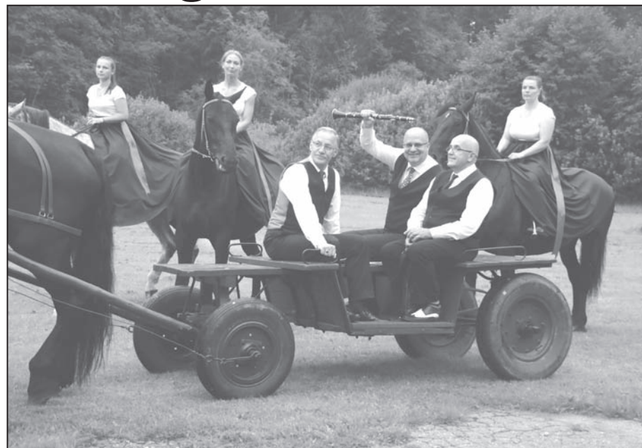
Leģendārā kapela «Bumerangs» gatavojas svinīgai iebraukšanai Valkas Brīvdabas estrādē

Tuvāk pusnaktij sākās dejas ar DJ Dzintaru. ☼