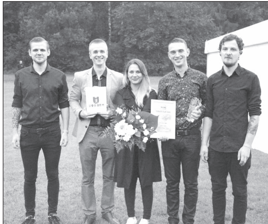
Melodiskā mūzikas raidījuma «Vilciens Rīga – Valka» dziesmu parādes uzvarētāji – grupa «Ceļojums».

Sobrid lapā – www.balšo.radosi.lv , ir apkopotas visas dziesmas, kuras ir izskanējušas melodiskās mūzikas raidījumā «Vilciens Rīga – Valka». Balso arī vasarā! Uz tikšanos jaunajā sezonā. ☼