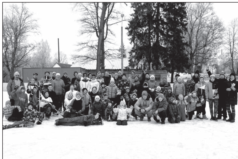
Ziemas sporta diena Vijciemā pulcēja gandrīz 100 dalībnieki un līdzjutēji.

Paldies dalībniekiem, tiesnešiem un līdzjutējiem! ☼