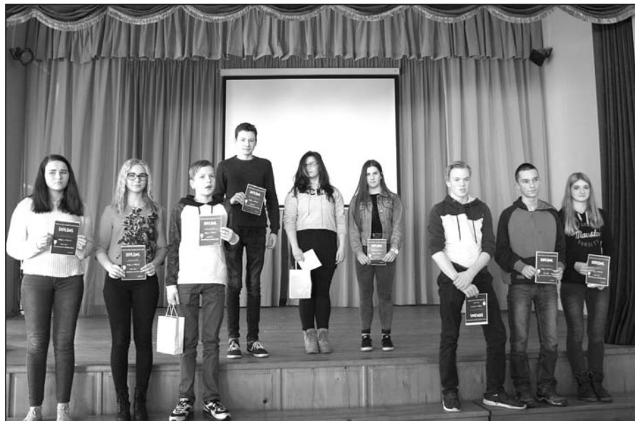
8.klases skolēni pēc pasākuma