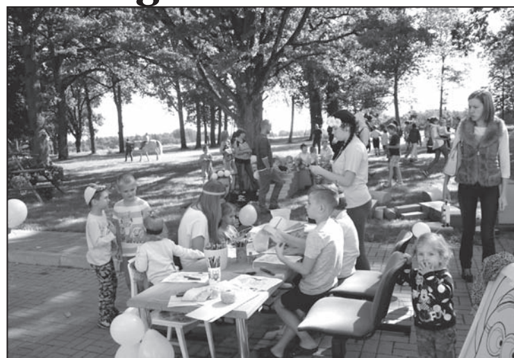
Saieta nama Lugažu muižā Minionu ballīte bērniem.

ar Jāni Žagariņu. Septembra mēnesim raksturīgs pasākums dzejas dienas, kurās labu atmosfēru nodrošināja Valkas literātu apvienība – dziesmas, dzejas un prozas lasījumi. Sākoties aukstajiem ziemas mēnešiem, nu jau par ikmēneša notikumu ir kļuvuši spēļu vakari – pokers un zole. Novembrī ar košu jubilejas pasākumu atzīmējām amatiereteātra «Rūdis» piecu gadu jubileju, popielas priekšnesumi kā dāvana no citiem draugu amatiereteātriem bija emocijām un smiekliem bagāts vakars. Decembra sākumā saieta namā «Lugažu muiža» viesojās Vīciema amatiereteātris «Ciekurs» ar «Ķīnas vāze» pēc teātra uzveduma balle ar «Sestā jūdze». Gaidot gada gaišākos un ģimeniskākos