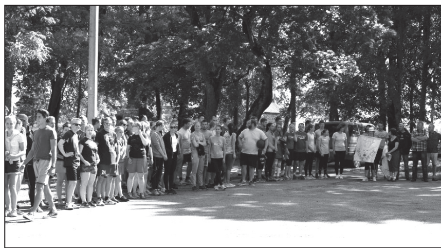
15. Valkas pagasta Vasaras sporta spēļu dalībnieki.

pagasta Lugažu un Sēļu komandas. 23.jūlijā Lugažu pludmales volejbola laukumos notika Valkas novada volejbola tūres 2.posms. Piedalījās 10 komandas, 6 meistarū grupā un 4 tautas grupā, t.sk. divas komandas no Valkas pagasta. 16.jūlijā, Lugažu muižas parkā norisinājās Valkas pagasta 15.sporta spēles. Pēc sporta aktivitātēm Lugažu muižas parkā, sākās «Teātra sports», bija ugunskurs un desiņas, bet vakara noslēgumā balle ar «Jērcēnmuižas muzikantiem». Šis bija gada apmeklētākais sporta pasākums, kurā piedalījās 120 dalībnieki. Liels paldies par atsaucību un entuziasmu piedalīties!