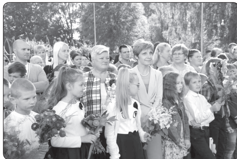
Pirmā Zinību diena Valkas Jāņa Cimzes ģimnāzijā.

Sekojiēt mums līdzī Valkas novada tīmekļa vietnē www.valka.lv un mūsu sociālajos tīklos – Facebook, Twitter, Draugiem.lv un Instagram - Valkas novads!