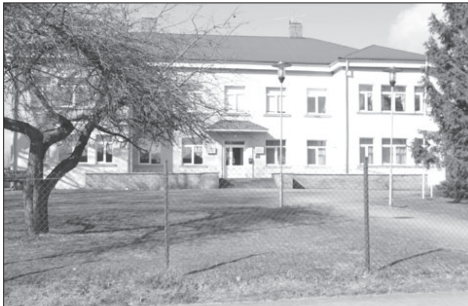
SPII «Pumpuriņš» ēka Puškina ielā 10, Valkā

Teksts un foto: Ivo Leitnis, Valkas novada domes Sabiedrisko attiecību speciālists