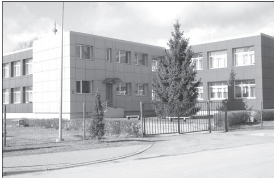
PII «Pasaciņa» ēka, Ausekļa ielā 44 Valkā