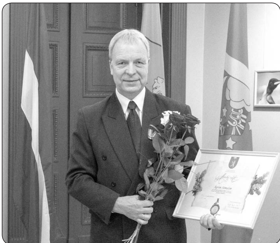
VAS CSDD Valkas klientu apkalpošanas centra vadītājs, Valkas pilsētas un Valkas novada domes deputāts no 1997. - 2021.