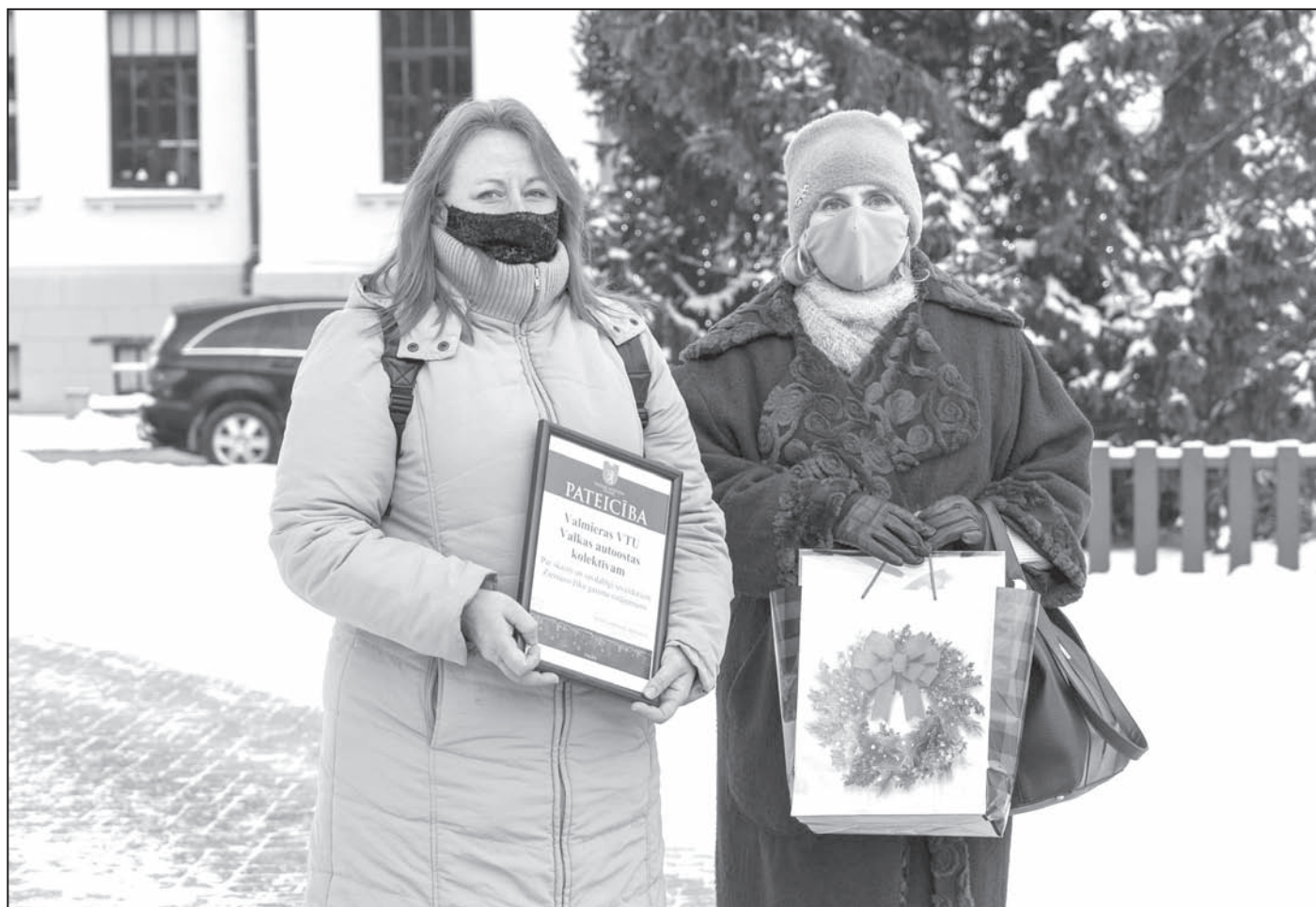
Par skaistiem Ziemassvētku gaismu rotājumiem Valkas novada domes pateicību saņem Valmieras VTU Valkas autoostas kolektīvs

Vēl grūtāk izvērtēt bija daudzdzīvokļu māju logus, lodžijas un balkonius. Saprotot, ka nav iespējams uzskaitīt visus objektus, jāsaņem paldies ikvienam valcēnietim, kurš izvietojis ar rokām gatavotu rotājumu, ko ļoti labi var redzēt dienā, un arī tiem, kas logā ievietojuši kaut vienu gaismas objektu. Kopā tas radīja iespaidīgu pilsētas izgaismojumu. Ne viens vien ir pārsūtījis saviem radiem un drau-