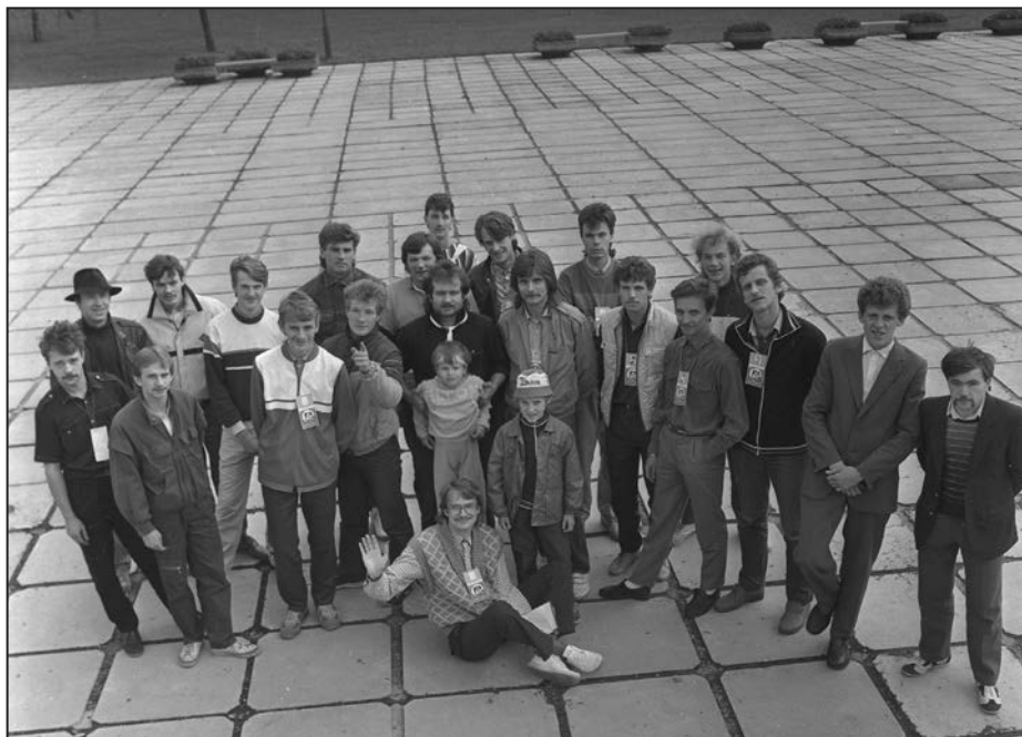
1987. gada diskotēku draudzības festivāla dalībnieki - grupu vadītāji un diskotēkari. Valka.