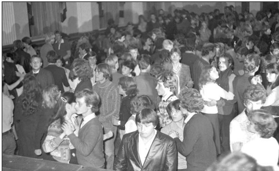
Publika pirmajos disko svētkos Valkā. 1982. gada 8. oktobris.

jeb tarififikācija. Maksas pasākumos nedrīkstēja uzstāties diskotēkas, kas nebija izgājušas tarififikācijas skati. Vispirms notika rajona, tad zonas un pēc tam Latvijas skates.