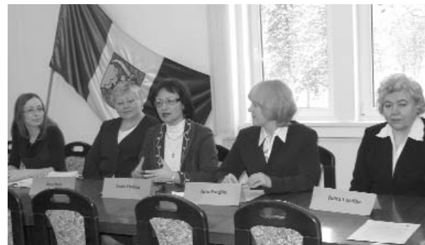
Tūlīt komisija atvērs Kopienu iniciatīvu fonda rīkotā konkursa „Mēs Valkai - Valka mums” iesniegtos projektu pieteikumus