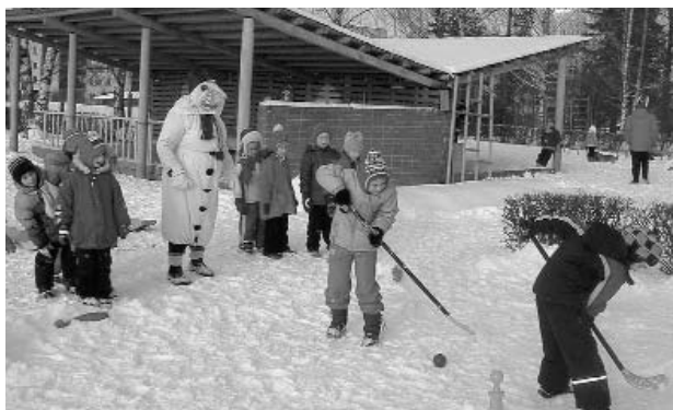
Ziemas sporta diena Pirmsskolas izglītības iestādē „Pasaciņa”

❖ Aktīvās atpūtas cienītāji aicināti uz slēpošanas tra- si Valkas pagasta teritorijā, netālu no ģenerāļa Pētera Ra- dziņa piemiņas akmens vietas. Slēpošanas trases garums ir 5 km. Lai tur nokļūtu, ir jābrauc pa ceļu „Valka - Ērgeme” līdz autobusa pieturai „Roņi”, pie norādes „Ģenerāļa P.Ra- dziņa piemiņas vieta” ir jāgriežas pa labi, pēc apmēram 100 m ir jāgriežas pa kreisi, un tad šķērsojot mājas pagalmu, jau esam pie slēpošanas trases.