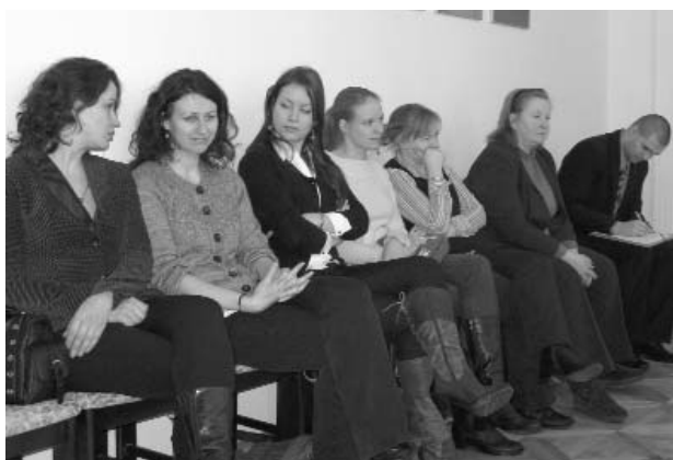
Projektu iesniedzēji uzklausa konkursa „Mēs Valkai - Valka mums” komisijas teikto un gaida pieteikumu atvēršanu