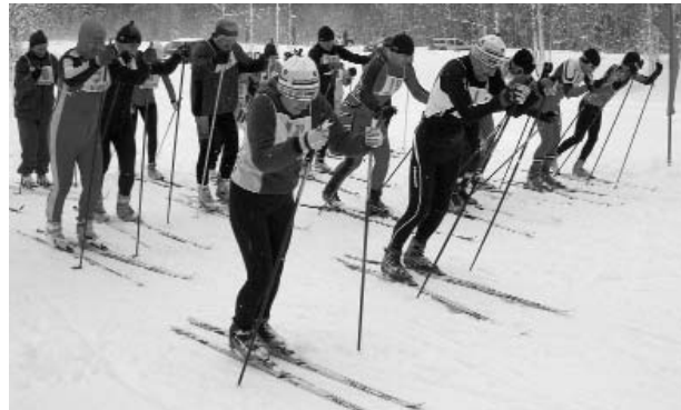
Tiek dots starts tradicionālajām Valkas pilsētas sacensībām distanču slēpošanā