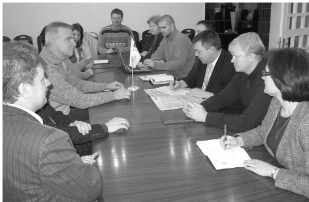
ES finansētā Igaunijas - Latvijas programmas projekta „Valgas - Valkas pilsētu atraktivitātes uzlabošana” darba grupai jāatrod piemērotākā un saimnieciski izdevīgākā vieta ledus hallei