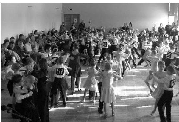
Svētku valsis Starptautiskajā sarīkojumu un mūsdienu deju festivālā „Ziemeļvalsis 2009”, kas šogad bija veltīts Valkas rajona Bērnu un jauniešu interešu centra 40. darba sezonai