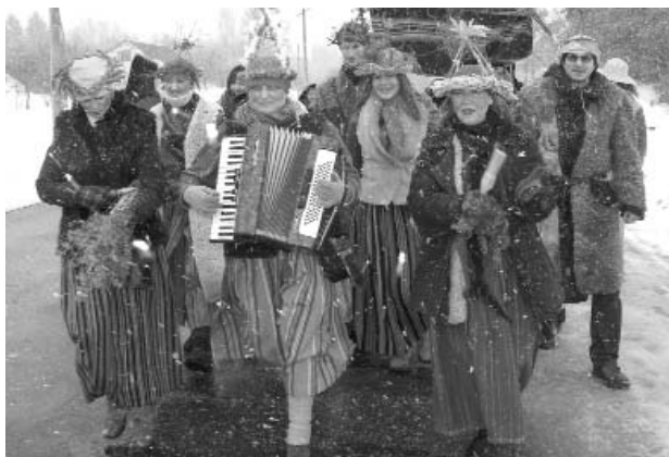
Valkas kultūras nama folkloras deju kopa „Sudmalīņas” 10. Starptautiskajā masku tradīciju festivālā Dagdā