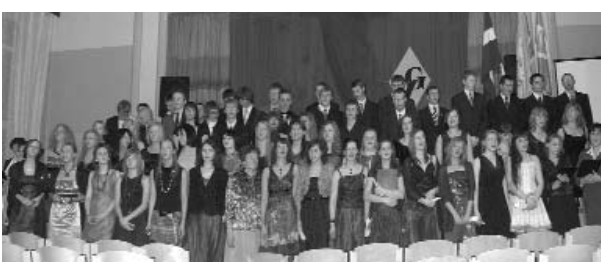
Viens no skaistākajiem ikgadējiem pasākumiem Valkas ģimnāzijā - 12. klašu skolēnu Žetonvakars, foto Una Veinberga