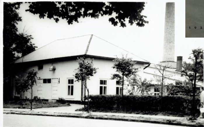
Valkas pienotava 20. gs. otrajā pusē