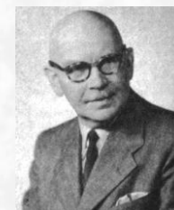
Arhitekts Augusts Raisters