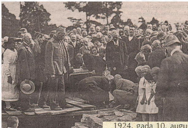
Ziemeļlatvija, 1997, 17.maijs

1924. gada 10. augustā Valkas sabiedrība pulcējās Lugažu laukumā uz tautas nama pamatakmens likšanu. Klāt bija visi ievērojamākie darboņi.