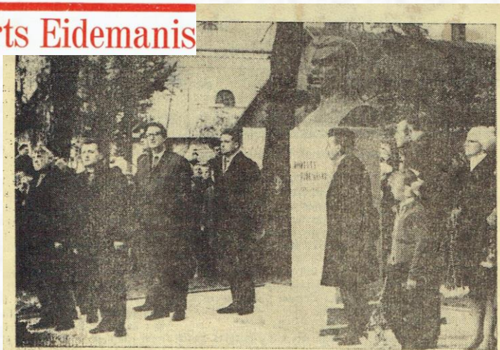
Pirmsjubiļes dienās Valkā atklāja pieminekli izcilajam karavadonim, rakstniekam revolucionāram, mūsu novadniekam Robertam Eidemanim. Sirsnīgajā mitīgā (altēlā) piedalījās arī republikas rakstnieki un dzejnieki. Šim brīdim tapa Ziedoņa Purva dzejolis – «Mūsu paldies».