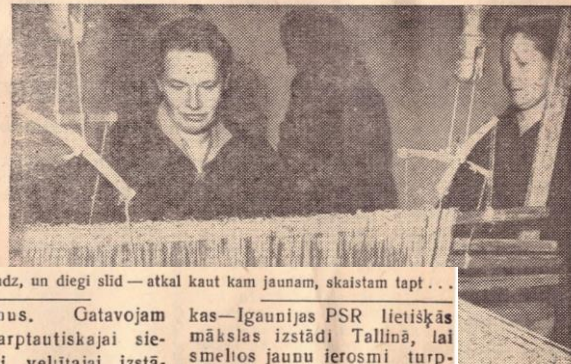
Stelles klausd, un diegi slid – atkal kaut kam jaunam, skaistam tapt . . .

Loti al Anna dze M arī vi pulciņa Majja garo c Sītoni Tag, cas ste dienās Patlaili divānu karus, materi