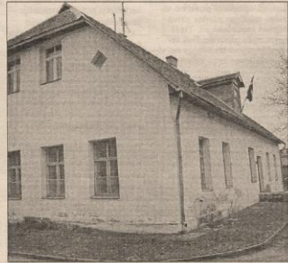
Valkas rajona bērnu un jauniešu sporta skola 50 gados ir pārdzīvojuši arī grūtus laikus un daudzas reorganizācijas, taču turpina strādāt.